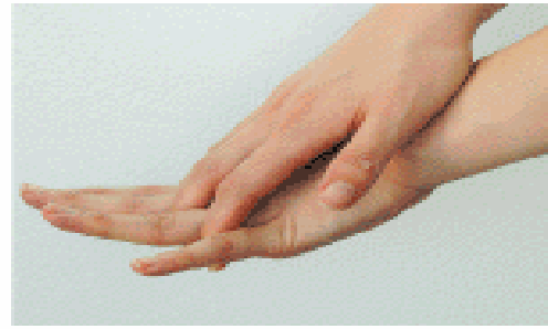
2. 手の甲を伸ばすように洗う