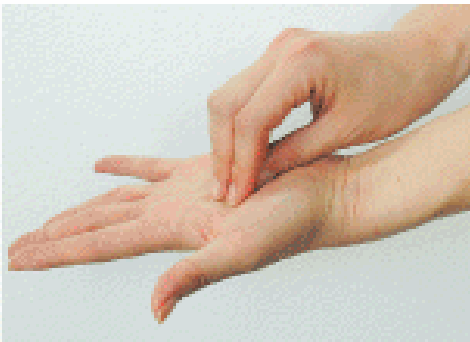
3. 指先・爪の間をよく洗う