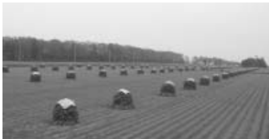
秋の風景は 筆をとってみたいくなる。

が各々五十六のグループに属し、また、グループに属さない認定農家八十八戸が、合わせて新たな制度の担い手としてスタートした。しかし、今なお担い手となっていない、二百六十戸の個人単独農家を、さらに「認定農家」のみで、支えることは困難な状況にあることから、組織（グループ）化を進めているものである。