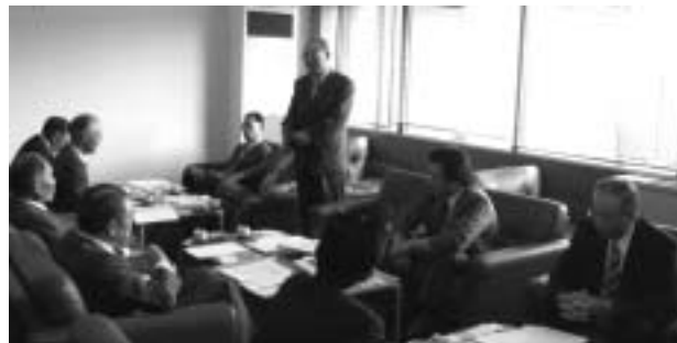
：宮城県河北町 研修の前にまずは委員長の挨拶から・・・