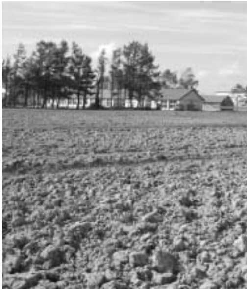
都会と農村をつなぐ公園予定地

備、利用、維持管理計画について伺いたい。 町長 現在、関係機関と内容を検討している。財政事情から、七百億円超の事業一環であり、当初計画通りの施設整備は困難であると考えている。地域改良区等と連携し、事業の目的である景観整備、ファミリー農園を運営してきたこと等を踏まえ、都市住民との交流により、地域が活性化されるような施設となるように検討したい。 事業は、平成十八年度、平成十九年度の実施計画となっている。