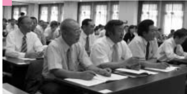
議会広報研修会：札幌市 今号発行の議会だよりの参考に・・・