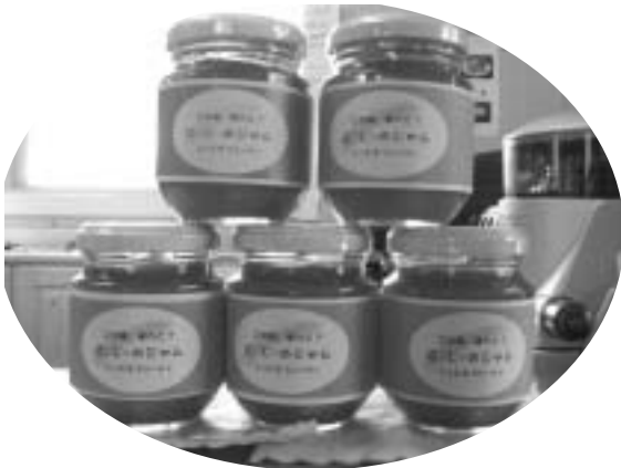
にんじんのジャム。食べたらずみつき!?

要な責務の絶対条件として、例えば、異物混入の100%防衛。安全な給食作りのため就業職員の健康管理。食材の吟味、検査。運搬時の衛生確保等がある現在の給食センターの体制の中では、発議のような事業の同時展開は、衛生上非常に難しい。 給食センターの有効活用について、例えば今後保育所の給食などに有効活用していくことは行財政システム再構築プランの中で多くの人に検討していただきたい。 したがって、地元農産