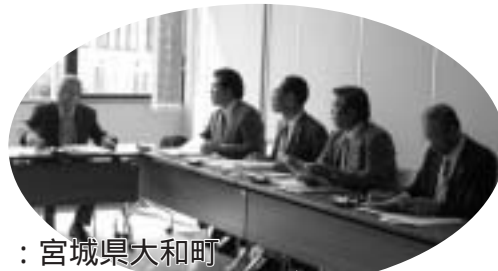
：宮城県大和町 活発な意見交換がされました。