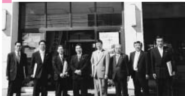
上：秋田県天王町 下：宮城県大河原町 十分に色んなはなしができた・・・ すがすがしい面持ちの委員さん。