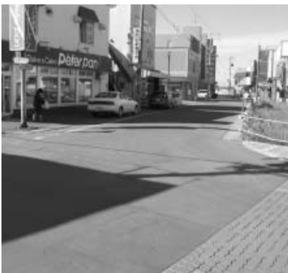
冬期にはツルツル路面が予想される交差点

交通量の多い交差点の路面のつるつるな状態の安全対策としては、環境に配慮して砂などを散布するとともに安全な路面の確保に努めてきたが、今年度もさらに道路のパトロールを強化し、適切で、効果的な散布などを行つて、路面の安全に努めたい。