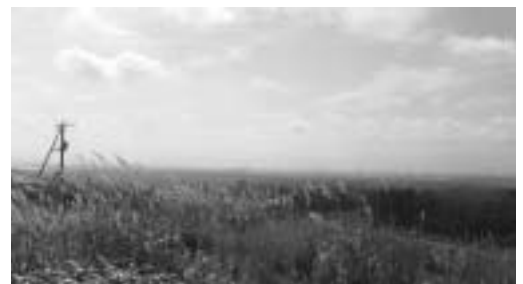
民意の決断を静かに待つ展望公園用地。 (秋の虫の音が心地よい)