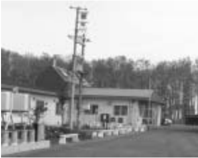
隣り合う町と民間の老人ホーム

町長 新たな行財政シス テムの再構築を図るため、 住民参加の推進「事務事 業の見直し」「行政組織 の見直し」「財政基盤の 健全化」の四つを柱とし て改革を推進し、総合計 画の推進基盤の確立を目 指し、重点的な施策の取 り組みについてもプラン の中で示していきたい。 このプランは、総合計画 の推進基盤確立のため策 定するものであり、第四