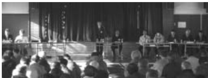
当別町水田農業ビジョン 地域説明会の様子

いくのを難しいとは考えていない。国に対して単一的に法人化することの方がナンセンスだと要望し続けていきたい。 当別町では水田農業推進協議会があり、充実した農家づくり、自立したいができない方々を組織化していくこと等を協議している。今後も産地づくり交付金について、当別町の水田農業推進協議会でさらに協議されると考えている。