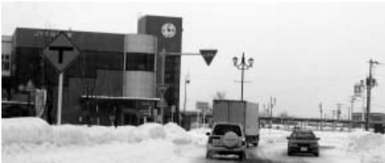
当別の要所 石狩当別駅

通勤、通学者や駅周辺利用者の駐車場である。今後、駅南広場の駐車場を駅周辺の利用者のための専用駐車として利用することを検討したい。大通りの街並み形成については、駅前のレンガ倉庫の整備と総合交通体系の確立によって、JRやバスの待ち時間にシヨッピングや軽食を取るなど、賑わいの創出につながり、必然的に通りの需要と価値は高まる。今までの議論の過程で町はそういう再構築プランを検討している。