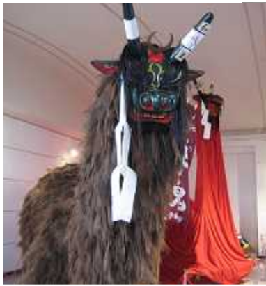
牛鬼（うしおに） 宇和島の代表的なお祭り（牛鬼まつり）の 主役

当別産農産物（トウモロコシ 1,000 本、ジャガイモ 100 kg、ミニトマト 12 kg）と加工品（コーンスープ・トマトジュース・いも団子汁）を販売し、大盛況で両日とも1時間弱という短時間で完売となりました。