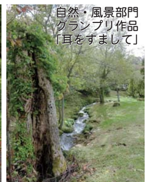
自然・風景部門 グランプリ作品 「耳をすまして」