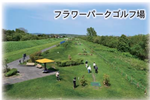
フラワーパークゴルフ場