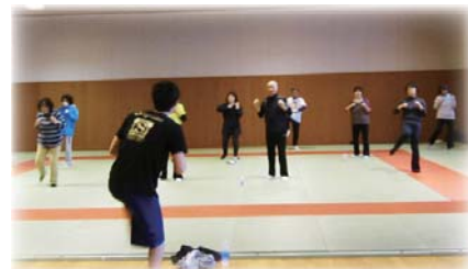
スタジオプログラムの様子