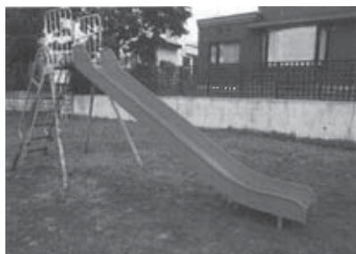
滑走面のフレームを取替えたもみじ広場の滑り台