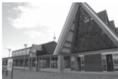
北欧の風 道の駅とうべつ

○ドライバーより、テイクアウトの商品をもう少し安く量を多くして欲しい。ラーメン、カレーライスを期待している。