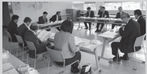
倶知安町議会での研修の様子