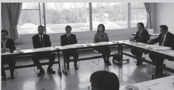
白老町議会での研修の様子