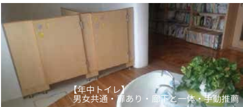
【年中トイレ】男女共通・扉あり・廊下と一体・手動推薦

年少年中は男女共用で廊下と一体化した明るいトイレで、年長は男女別の落ち着いた和風。扉の有無や自動水栓か否かも