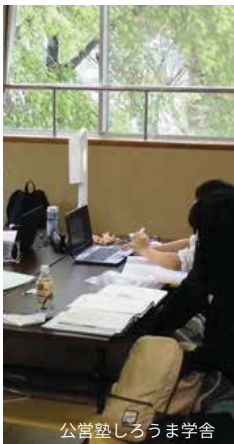
公営塾しろうま学舎

廃業した民宿を村が買い取り遠隔地から白馬高校に入学する生徒のための教育寮に改装しました。管理人夫婦が住み込みで日常生活の世話をしてい