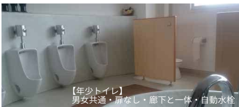
【年少トイレ】男女共通・扉なし・廊下と一体・自動水栓

校舎にも理念に基づいたこだわりが随所に見られます。トイレは、年少・年中・年長ですべてが違う造りです。