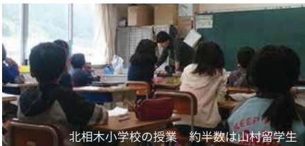
北相木小学校の授業 約半数は山村留學生

北相木小学校に山村留学する場合には、保護者とともに1泊2日村に滞在し体験入学をする必要があります。この場が事実上の入学選考になっています。また過去の山村留学の失敗を踏まえて、村の子どもたちの学年ごとの人数・性別を踏まえ、各学年男女何名ずつ山村留学で受け入れるかを決め、教育環境の維持に努めています。