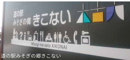
道の駅みそぎの郷きこない

働き始めたのは道の駅開業の3年前でした。道の駅開業後はコンシェルジュとなることを前提に地域おこし協力隊として着任したのです。3年間の仕事は、「周辺9町のこのなら何でも知っている人」になるための修行でした。