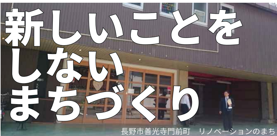
長野市善光寺門前町 リノベーションのまち

ここがポイント!! ▽ 「まちづくり」＝「新しいことをする」からの脱却 ▽ 地元密着・地元向けの情報発信 ▽ 移住希望者とはじっくり時間をかけて 門前町ですすむ空洞化 長野市は長野県の県庁所在地で人口はおよそ37万人、古くから善光寺の門前町として栄え、いまも長野県北部の観光の拠点です。1998年には長野オリンピック・パラリンピックも開催されました。善光寺の門前帯はまた、古民家や商店を改装したカフェやアトリエ、ギャラリー、オフィスなどが入居するリノベーションの街としても注目されています。 善光寺門前町も他の多くの地方都市と同じく、高齢化・人口減少・空き地の増加といった課題を抱えています。昭和30年代には約17,000人いた人口が平成22年には6,600人まで減少しました。人口減少比べて世帯数の減少が少ないことから、1世帯あたりの人数が減少していることが特徴です。また高齢化もすすんでいることから高齢者のみの世帯や独居世帯が増加していると考えられます。