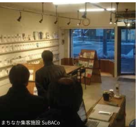
まちなか集客施設 SuBACo

平成19年に5カ年の中心市街地活性化基本計画を策定し、様々な活性化策や市立病院の移転改築などによって中心市街地への流動確保に努めてきました。そして平成21年度に地域おこし協力隊制度が始まったことを受けて、平成25年からこの制度を活用してまちなか集客施設 SuBACo を開設しました。以前から構想があった商店街の情報発信施設の整備とそれぞれ要望が出ていた商工会議所・観光協会との事業パワーアップを目指して導入したものです。