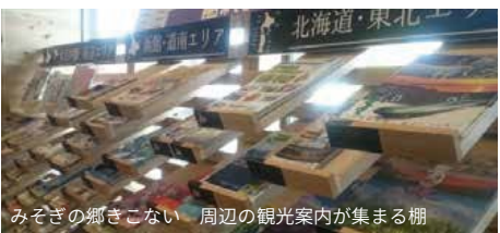
みそぎの郷きこない 周辺の観光案内が集まる棚

道の駅みそぎの郷きこないは北海道新幹線の開業にあわせて、渡島西部・檜山南部9町の広域観光拠点として整備されました。運営態勢は木古内町を中心に構成されていますが、9町による新幹線木古内駅活用推進協議会から年間50万円の業務委託費が支払われています。観光コンシェルジュはこの9町のことをすべて案内できなければいけません。そこで、地域おこ