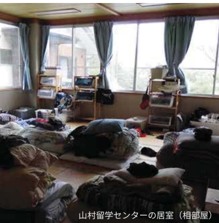
山村留学センターの居室（相部屋）

ため2010年には3人となります。これにより全児童数も28人となり村民から学校統合の陳情が提出され議会で採択