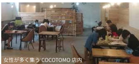
女性が多く集う COCOTOMO 店内

そこで、いまの顧客ニーズにに応えられる新たな店舗を商店街に迎え入れれば良い、と発想を転換したのです。顧客ニーズは時代によって変化します。その変化を受け入れ、個々の店舗の入れ替わりをも許容することで、商店街全体の活気を保つという考え方です。