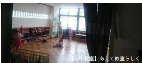
【年中教室】あえて教室らしく