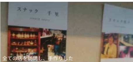
全ての店を訪問し、手作りした

共通デザインのシヨップカードは人気があります。協力隊が全ての店を訪問して作っているのでお店の案内もでき、