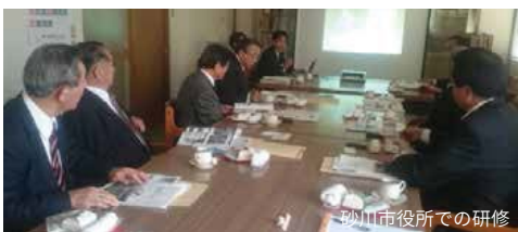
砂川市役所での研修

嘱託職員の長所は、社会保険加入です。短所は通常の公務員と同様の制約をうけることです。特別による対応は可能ですが、通常は兼業が禁止されます。また、一人あたり最大200万交付税措置される活動経費が自治体の予算に組み込まれるため、予算を使った活動