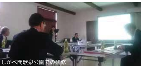
しかべ間歌泉公園での研修

団体ツアーの呼び込み体験型ツアーの開発以外にも道の駅店舗担当と別に担当者を配置しています。道の駅を含め国内の観光は激しい競争にさらされていますので、専任の担当者を配置してプロモーションに取り組む必要が高いことが改めて確認できました。