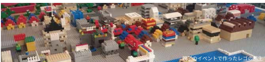
親子のイベントで作ったレゴの桐生

標です。しかし、商店街の衰退は近隣住民等の顧客ニーズに既存店舗が応えきれないことが大きな要因です。小規模小売店が多い商店街既存店舗が、従来のスタイルを変えて現在の顧客ニーズに合わせるのには用意ではありません。また、長年の顧客を失うことにもつながりかねません。それは、店舗にとってはもちろん、これまでの顧客にとっても望ましいことではありません。