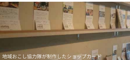
地域おこし協力隊が制作したシヨップカード

28年度に着任した第3期の地域おこし協力隊が、市内店舗への流動を高めるためにシヨップカードを制作しました。シヨップカードは地域おこし協力隊に札幌市立大学でデザインを専攻した隊員が制作しました。各店舗に協力隊が出向き協力を依頼して作ったもので店側から依頼があったものではありません。制作に通常かかるデザイン費や取材費は協力隊が行ったため一切からず、印刷も協力隊の活動経費で市販の名刺用紙を利用したため、店側の負担は一切ありませんでした。