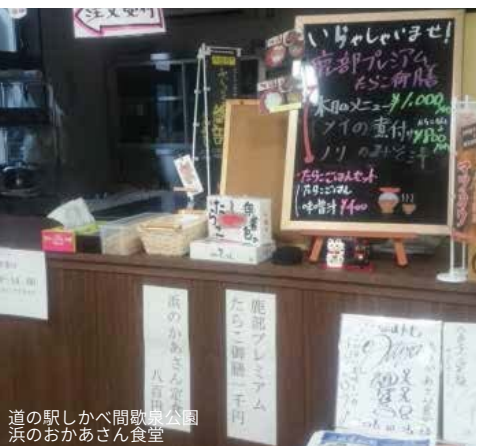
道の駅しかべ間歌泉公園 浜のかあさん食堂