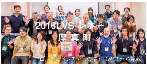
ローカルベンチャーの様子

その背景には一人の職員(キーマン)がいます。産業経済商工課観光林業水産グループの宮主査です。中途採用で厚真町職員となった宮主査が、西栗倉村の取り組みを講演