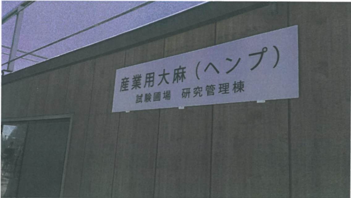
大麻試験圃場研究管理等