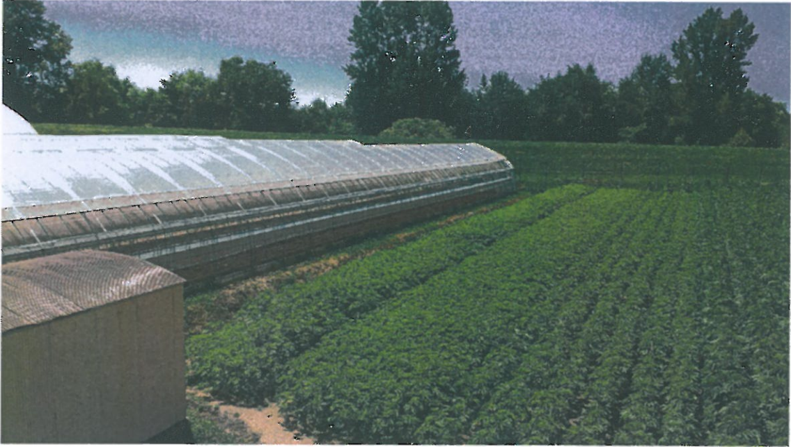
大麻の生育の様子