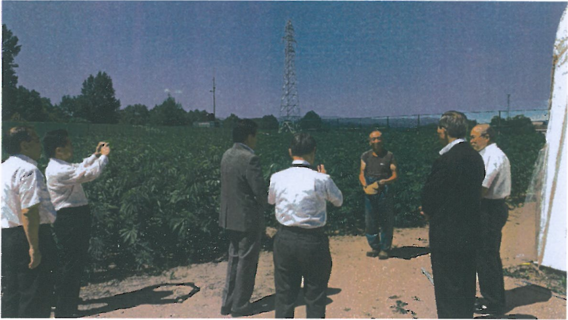
松家社長による説明