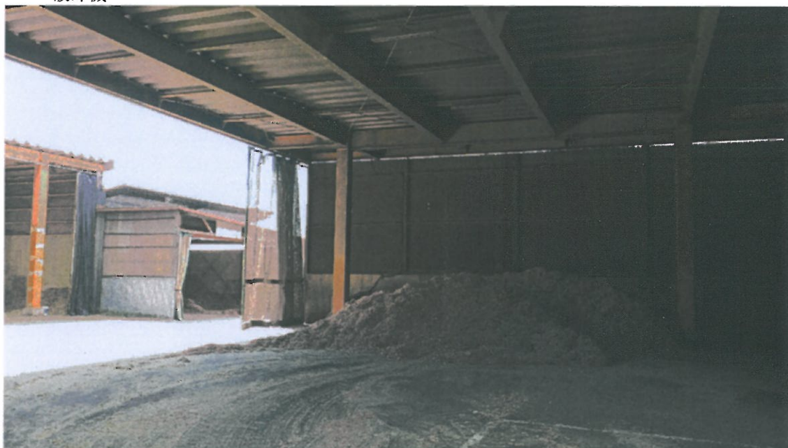
生産されたチップ