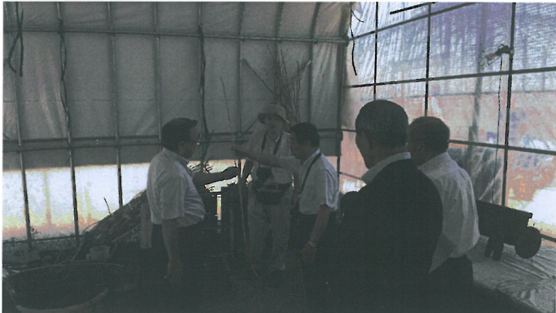
大型ハウスの内部