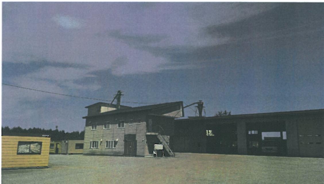
ケンセイシャフォレスト（チップ製造工場）