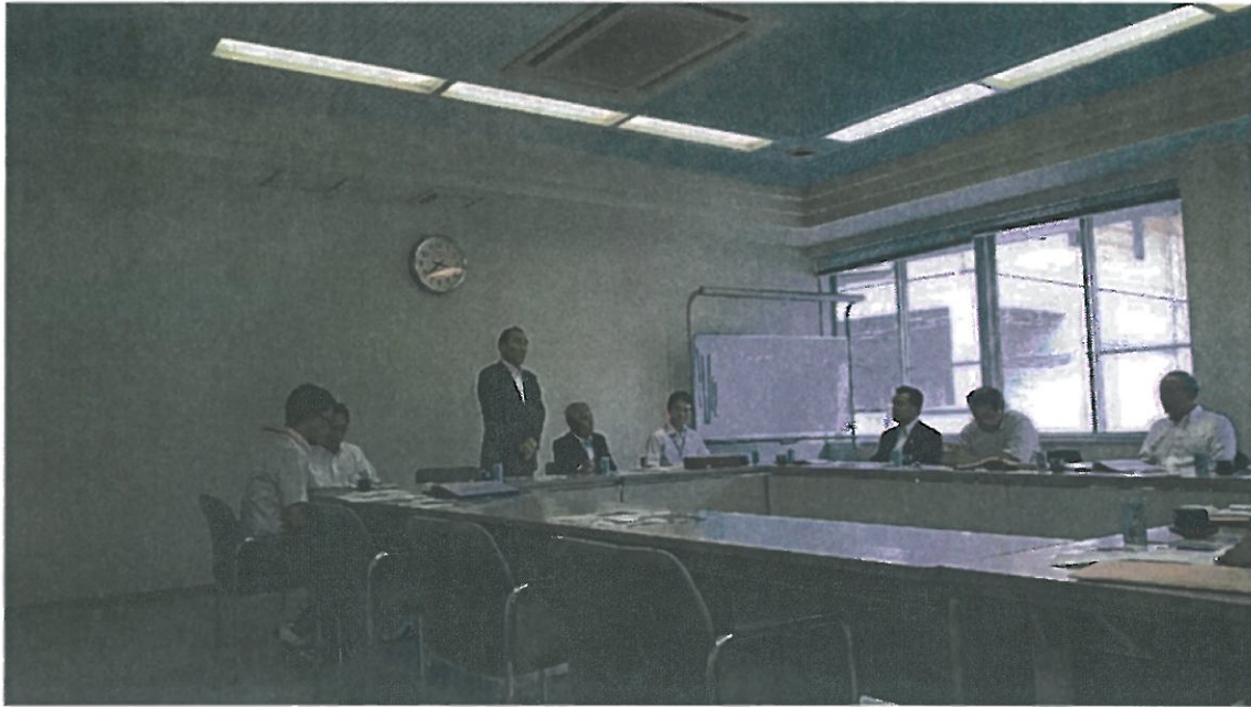
神山町役場での研修