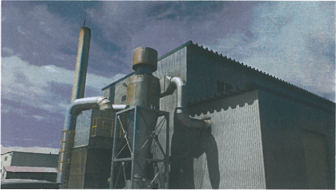
健誠社本社に設置されたボイラー棟