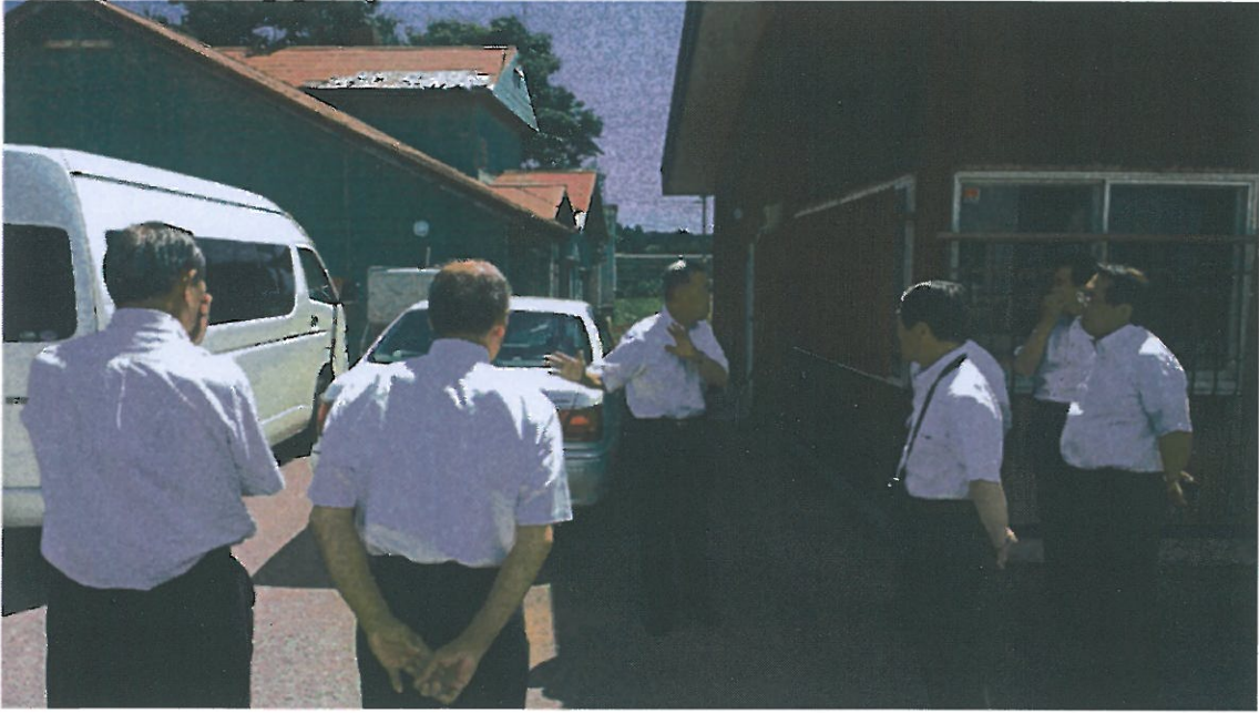
河東所長による説明