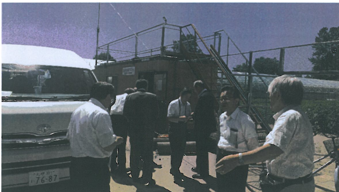
松家農園大麻試験圃場前