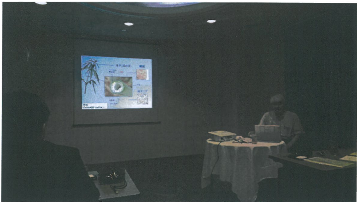
菊地代表理事による研修