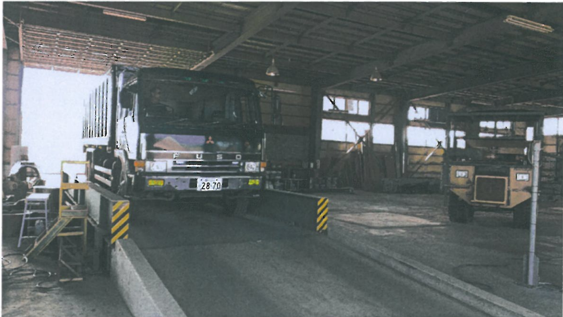
チップ原料（建築廃材等）の搬入