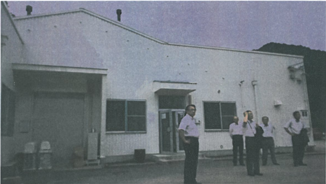
神山バレー・サテライト・コンプレックス（コワーキングスペース）視察