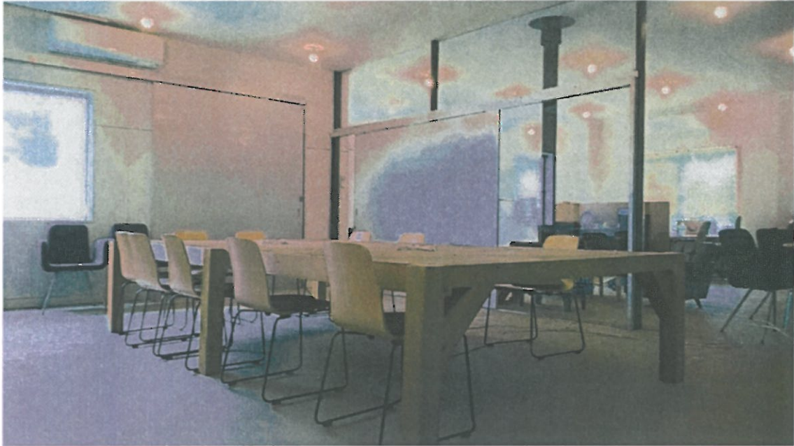
神山バレー・サテライト・コンプレックス内部