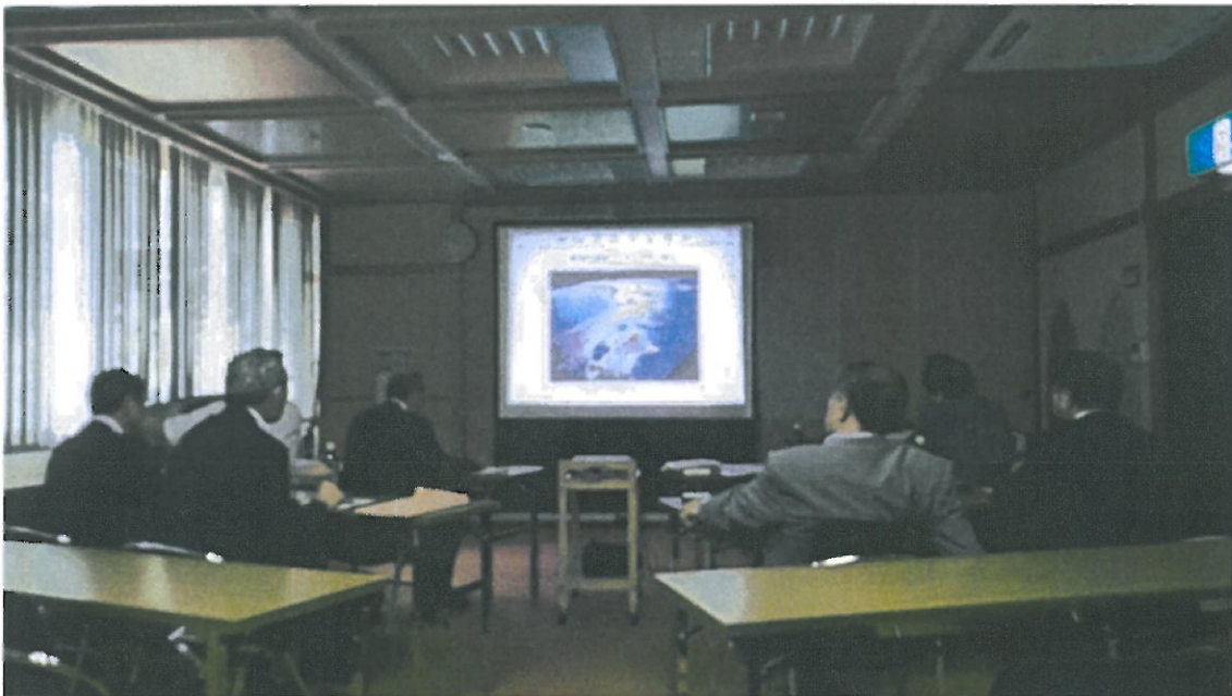
大南理事長による研修