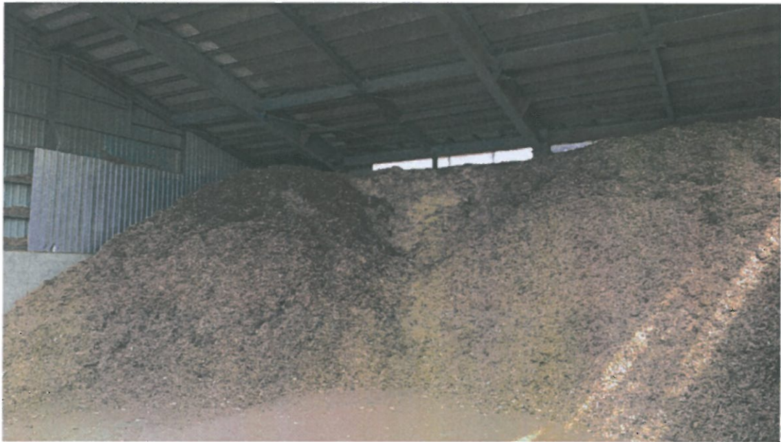
ボイラー脇のチップ保管場