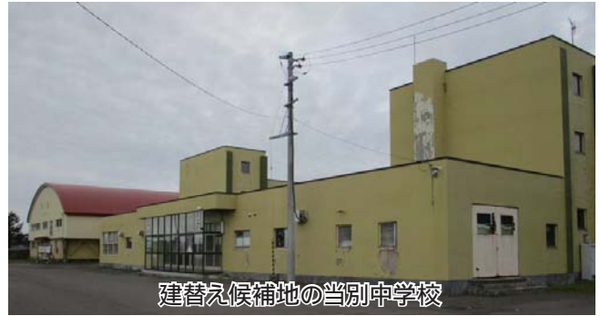
建替え候補地の当別中学校

平成 34 年度を目標に当別小学校と当別中学校を一体型の校舎に建て替えるための基本構想(案)の中間報告がありました。その中では、建設候補地や今後の進め方などについて、質疑が行われました。