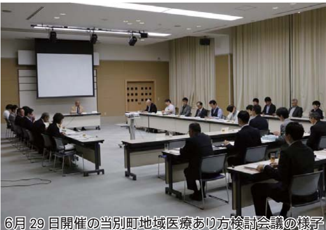
6月29日開催の当別町地域医療あり方検討会議の様子

堀江病院閉院に伴う町の対応の経緯や現状の説明があり、町内唯一の58床の医療療養病床が町からなくなることも伝えられました。また、将来を見据えた地域医療体制の全面見直しに向け、町内の医療・介護関係者等による当別町地域医療あり方検討会議を設置する旨の説明もありました。