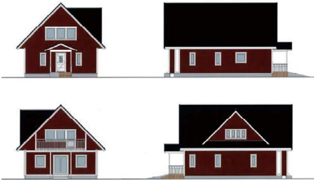
（仮称）スウェーデン館立面図（案）

スウェーデンハウス株式会社から、道の駅の敷地内に（仮称）スウェーデン館を建設し、町に寄贈する旨の申し出があり、これに併せて、建物の外構工事を行うことが提案されました。