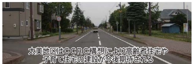
太美地区はCCRC構想により高齢者住宅や子育て住宅の建設が今後期待される

答 客観的に見れば適用となると考える。分ける理由については、新規・増設の差別化を図り既存企業もより活用しやすい制度としているところであるので、ご理解いただきたい。