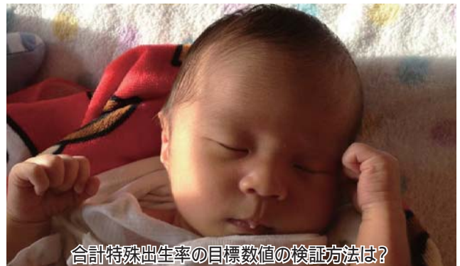
合計特殊出生率の目標数値の検証方法は?

当別町の合計特殊出生率は、5年毎の国勢調査の数値を基に国で算出したものを採用しています。そのため、総合戦略で掲げている平成31年の目標数値1.28をどのように検証するのか質疑がありました。