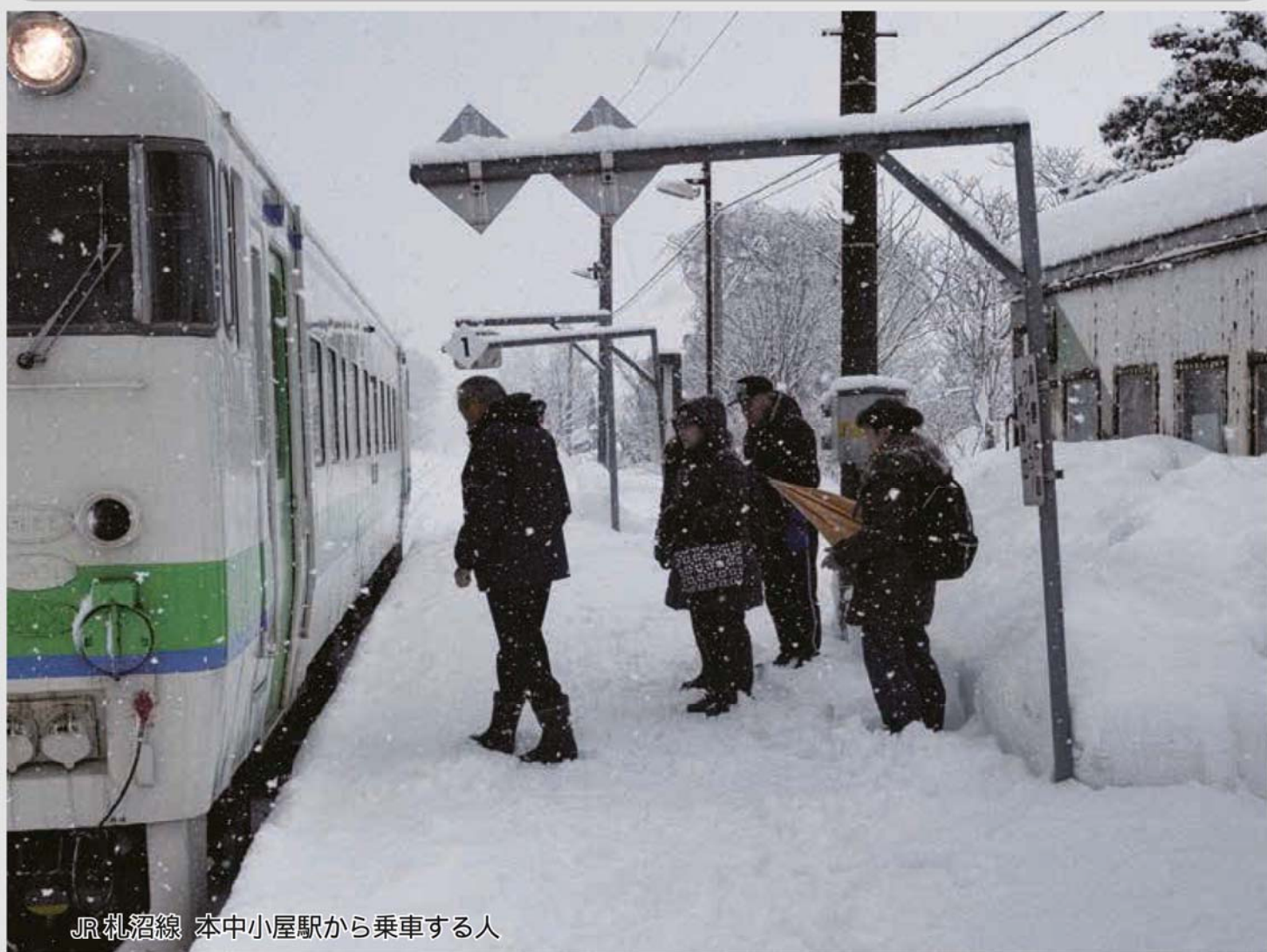
JR 札沼線 本中小屋駅から乗車する人