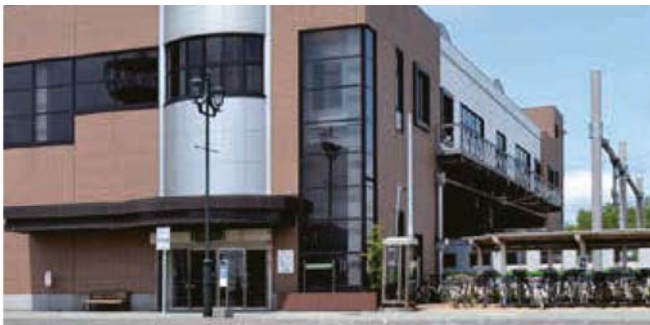
更新される当別駅のエレベーター

平成6年設置の町道当別駅南北連絡線エレベーターは、老朽化や部品の製造停止などにより、更新が必要であるため1,627万円の補正予算を提案する旨の説明がありました。