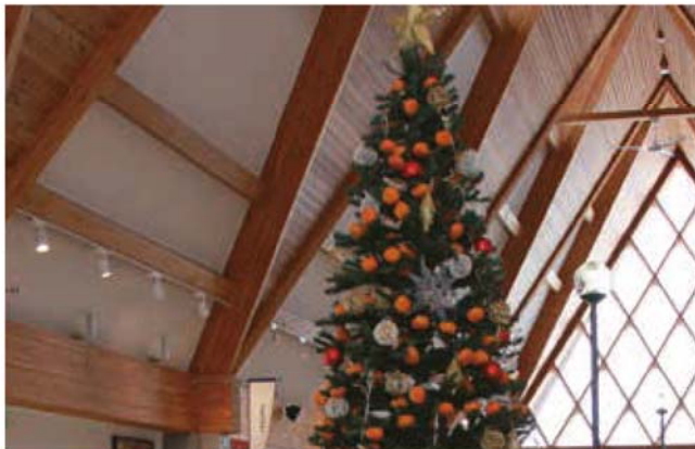
北欧の風道の駅とうべつに設置されたみかんツリー