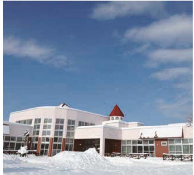
新年度より公私連携型認定こども園となるふとみ保育所

計画書は、事前に事業者と十分に協議をし、その内容を決定する。その内容が整った段階で、議会にどのようなかたちで提出できるのか検討させていただきたい。