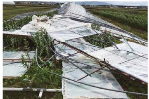
台風21号により倒壊したビニールハウス

相談件数は58件で、非常に厳しいハードルでもあったので要件を満たされなかった方もいたが、要件を満たされた方は、今回46件であった。