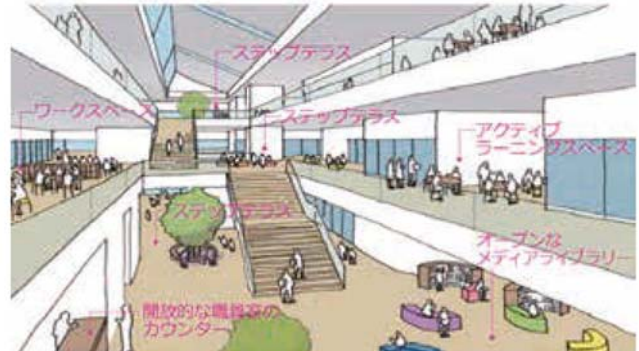
インナーガーデンイメージ図

校舎中央の自然光を取り入れ階段状に連続するステップテラスは地域や他学年との交流の場に。