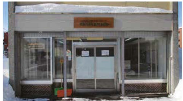
当別町障がい者総合相談支援センター ナナカマド (弥生)