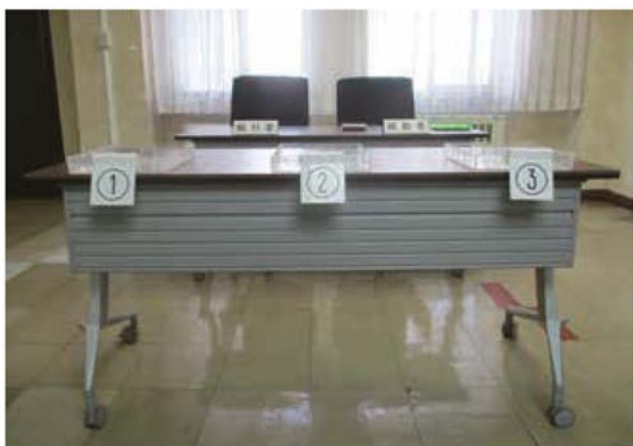
入札会場のイメージ写真

条件付一般競争入札は平成 27 年に見直し、以来 11 件実施してきた。試行期間を終えるにはさらに一定の実績を積み重ねる必要があると考えるので、もうしばらく試行期間を続けたい。