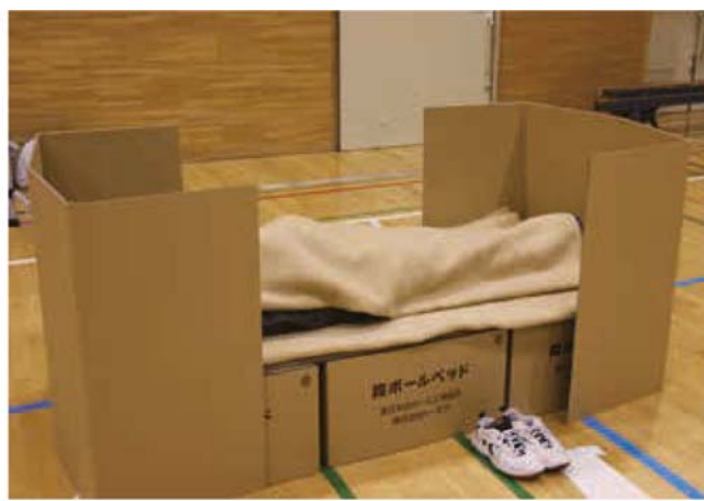
避難所で使用されるダンボールベッド

答 特に支援が必要な方は、福祉避難所のゆとろで対応。停電時の暖房等は、発電機、暖房、毛布等の確保に努めている。ペットについては環境省策定のペット救護対策ガイドラインを参考に進める。