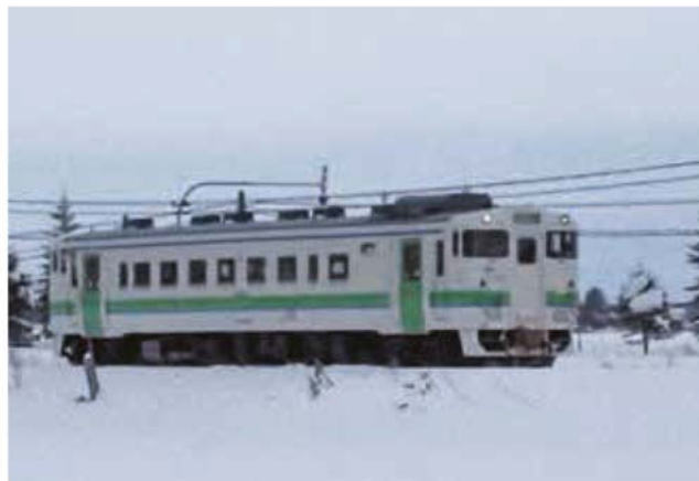
JR 札沼線を走るディーゼルカー

答 運行ルートは道路管理者や警察との調整が不可欠で要望どおりにならないケースもある。今後も沿線町内会に担当職員が通い、皆様の利便性が向上する路線の構築に向けて鋭意努力する。