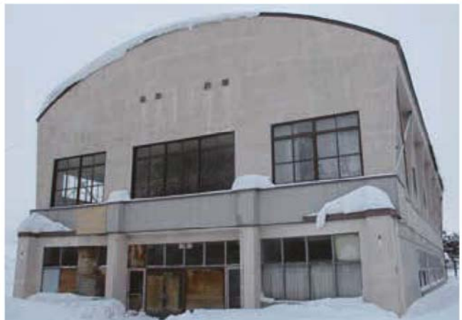
立地適正化計画にとって重要な場所にある旧公民館

答 旧公民館の場所は、今回一貫校を建てることもあり、居住地域としては大変重要な地域だと捉えている。立地適正化計画の中にも駅前開発と同様にしっかり位置づけされている。