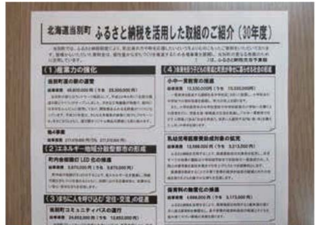
ふるさと納税の活用事例を紹介するチラシ

答 魅力的で満足いただける返礼品のラインアップ充実に努めている。寄附金をどのように活用しているかふるさと納税サイトで紹介すると共に、返礼品に同封してリピートしていただくよう努めている。