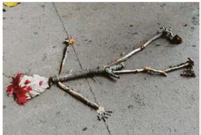
木の枝を使って比率を学ぶ「野外で算数」の1コマ

答 4名の図書館司書の有資格者を各学校へ派遣し、司書教諭と連携して環境の改善に取り組んでいる。雇用形態について、子育てや扶養家族のまま働ける点から幅広い人材を雇用できる。