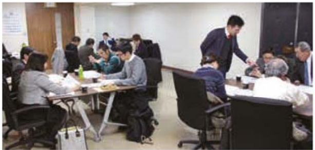
第 3 回とうべつ議会だよりモニター会議の様子 モニターの皆様、1 年間ありがとうございました。

とうべつ議会だよりモニター会議の記録 【モニター会議】 第 1 回 平成 29 年 12 月 6 日 「議会だよりの改善点」 第 2 回 平成 30 年 8 月 30 日 「オリジナル記事・独自記事」 第 3 回 平成 30 年 12 月 10 日 「編集方針(案)」