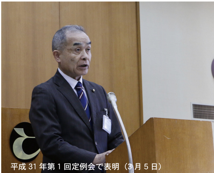
平成 31 年第 1 回定例会で表明（3 月 5 日）