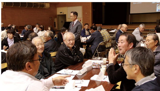
防災セミナーの様子（昨年 10 月、町主催）

昨年の台風 21 号に続く北海道胆振東部地震の災害を教訓として、当別町地域防災計画をはじめとする各種計画やマニュアルの見直しを行います。また、避難所の備蓄品を増加するほか、情報伝達訓練や図上演習といった防災に関する知識と技能の向上に努めます。