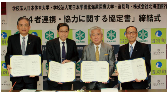
連携協定締結式にて（昨年 11 月）

昨年 11 月、青少年の体育・スポーツおよび健康づくりを目的に、4 者で連携協定を締結しました。今後は町内青少年の日本体育大学への派遣や、日本体育大学の教員・学生・OBなどの指導者の招へい、技術指導などの専門的な事業構築について協議を進め、早期の事業化に向けて努めます。