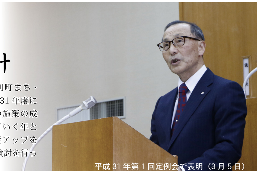
平成 31 年第 1 回定例会で表明（3 月 5 日）

人口減少対策として策定した「当別町まち・ひと・しごと創生総合戦略」は、平成 31 年度に最終年を迎えることから、これまでの施策の成果を分析し、次期総合戦略につなげていく年となります。人口減少の要因分析の精度アップを図り、要因・課題の整理および対策の検討を行っていきます。