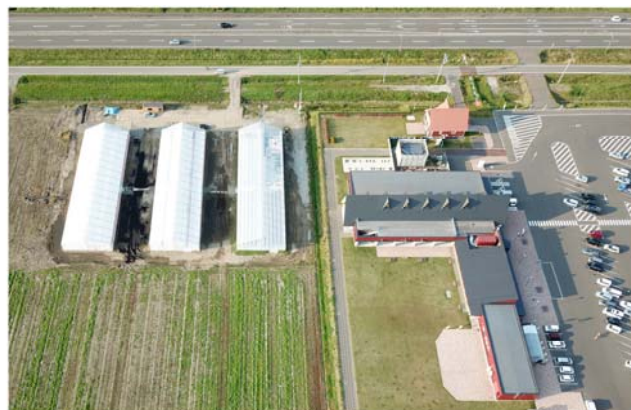
上空から撮影した道の駅といちご農園のハウス

この場所は、民有地であり、今回のいちご農園は、農業の一部の位置付けになるので、建設を規制できるものは何らない。4棟目以降は南側に増設がされていくのではないかと考える。