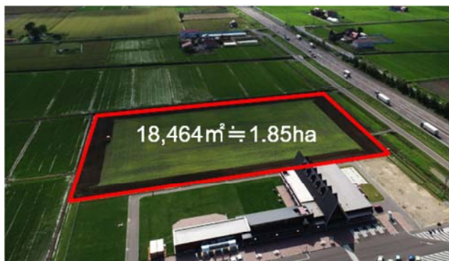
観光いちご農園の事業用地