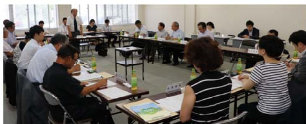
第1回当別町総合計画審議会(8月7日開催)