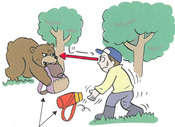
※これらの回収は自殺行為です。

クマから視線をはなさないで下さい。そしてクマの動きを見ながらゆっくりと後退して下さい。この時、リュックや服など持ち物をそっと置くとクマの気を引いて時間をかせげます。