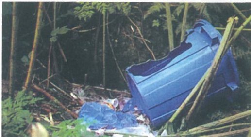
ヒグマに荒らされたゴミバケツ

実際に平成11年～21年度に渡島半島地域で銃器によって捕獲されたヒグマ586個体の胃袋を分析した結果、7.0%に当たる42個体からゴミ袋が出現しました。