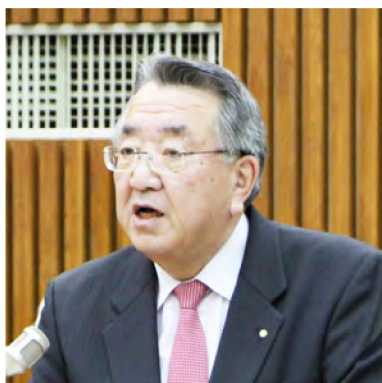
12月の一般質問にて