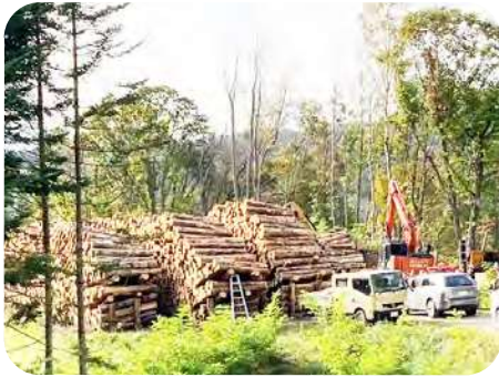
森林整備の作業現場