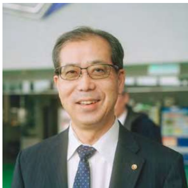
総合体育館ロビーにて

////////////////////////////////////// Q. 任期中に取り組みたいことは？