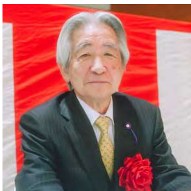
当別町はたちのつどいにて

////////////////////////////////////// Q. 任期中に取り組みたいことは？