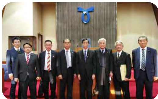
鷹栖町役場 議場にて

紋別市では、道都大学旧紋別キャンパスの誘致から撤退までの経緯経過や、市が行った大学へ対する財政支援の内容や金額などについて説明を受け、研さんを積んできました。