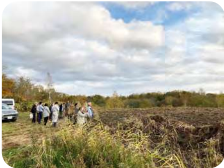
植樹を行う植栽地