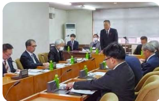
紋別市 視察の様子