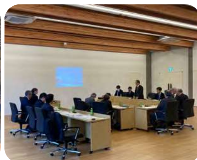
議場を兼ねた中ホール