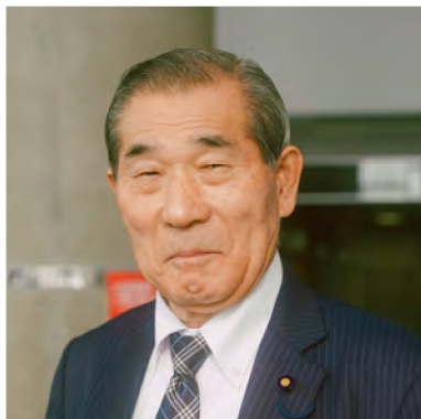
当別消防出初式にて