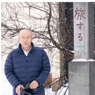
家具工房 旅する木の前にて

////////////////////////////////////// Q. 任期中に取り組みたいことは？