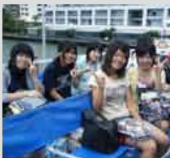
短期留学の高校生同士の交流