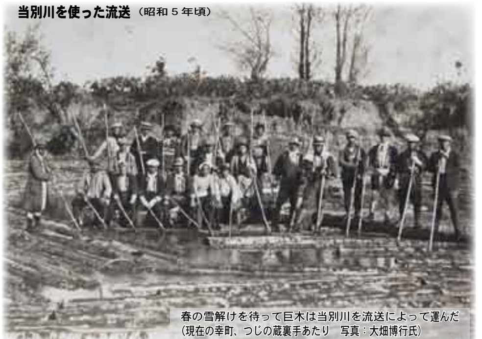
春の雪解けを待って巨木は当別川を流送によって運んだ （現在の幸町、つじの蔵裏手あたり）