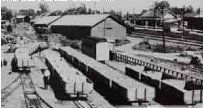
写真右上に旧石狩当別駅舎が見える。

町営軌道は当別川に沿って幾つもの長大な橋梁があり、洪水などの被害を受けやすかった。この頃、青山中央の人口はピークを迎えたが、森林資源も減少しつつあった。（昭和25年頃）