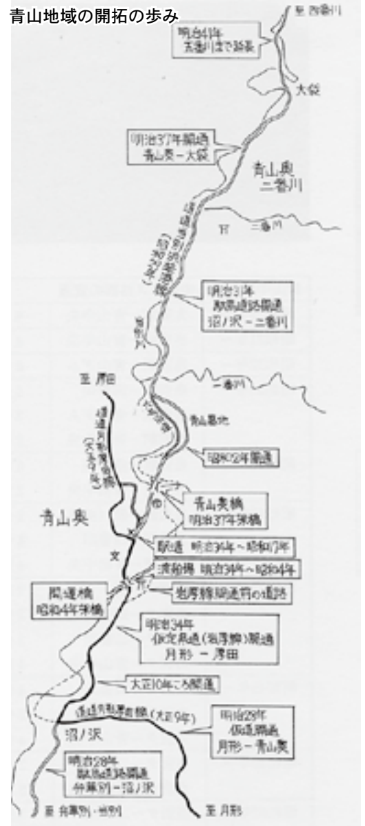
青山地域の開拓の歩み