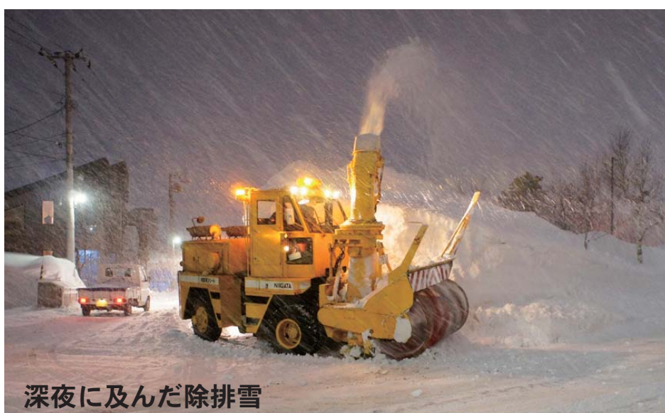
深夜に及んだ除排雪