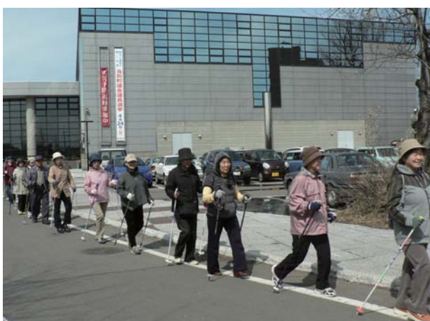
ストックウォーク講座

福祉や介護、医療に関する情報をはじめ、親子で楽しめる講座、楽しく体を動かす講座、防災・救急講習、当別ふれあいバスに関する講座など、全73講座があります。