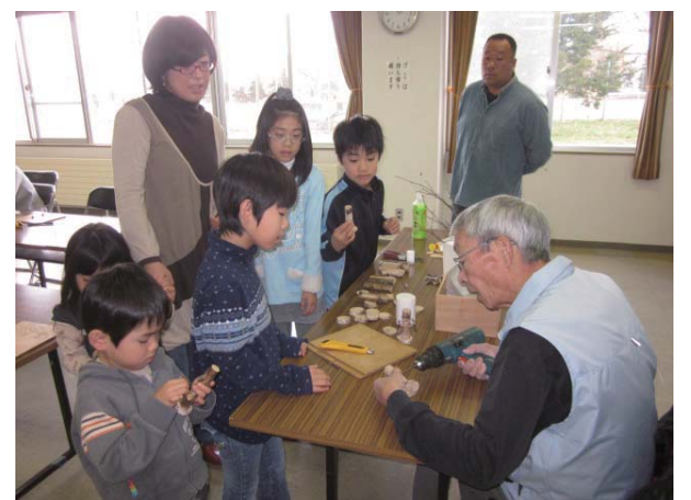
木工クラフト講座