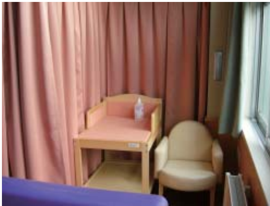
子育て支援センター (ふとみ保育所内)