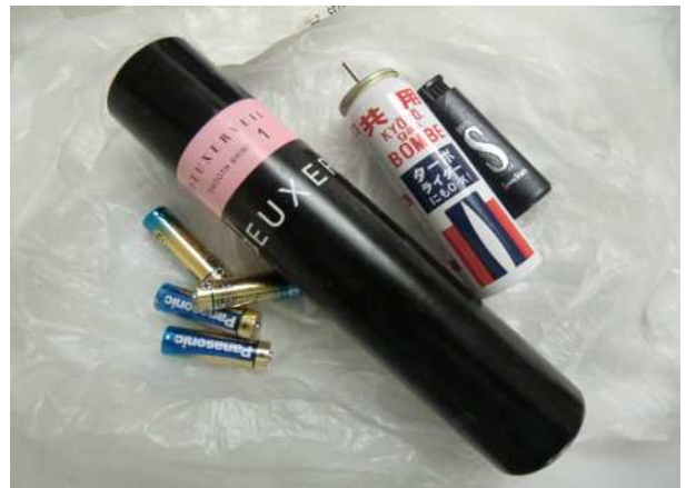
「燃えないごみ」の日に出された誤りの例。