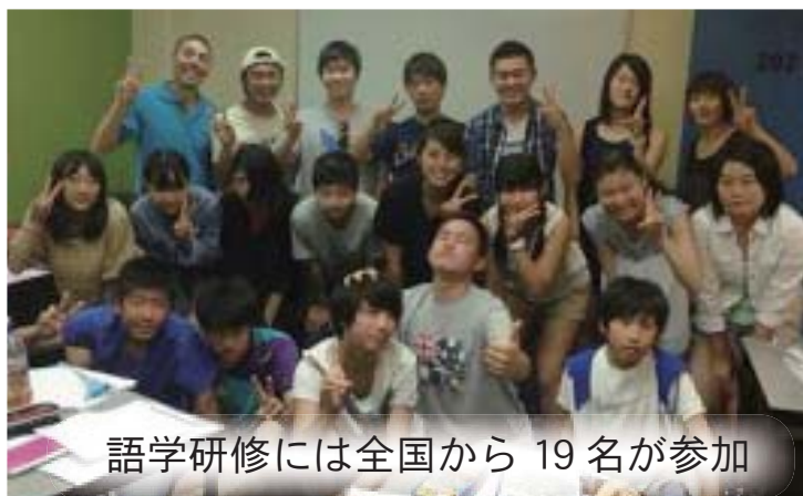
語学研修には全国から 19 名が参加