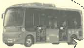
新型ノンステップバス