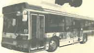
環境にやさしいハイブリッドバス