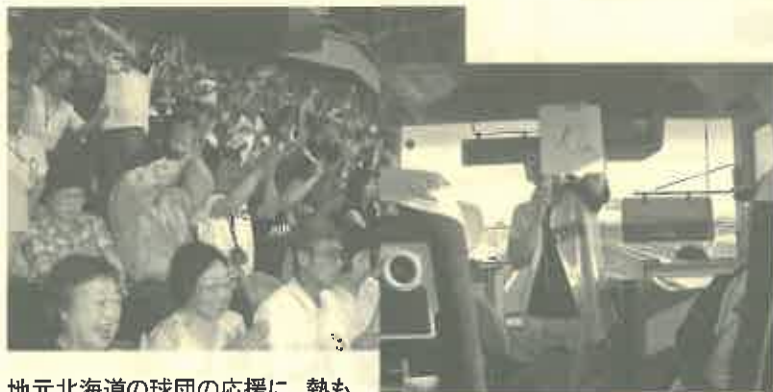
地元北海道の球団の応援に、熱も入ります。

車内では当別ファイターズクラブの協力 で、選手のサインを参加者に抽選でプレゼント。