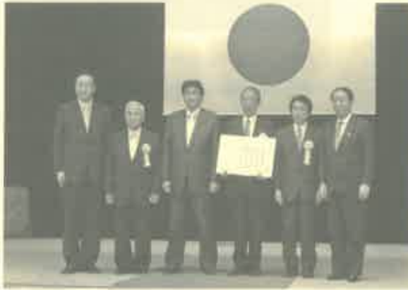
表彰式会場で国土交通大臣（左から3番目）と撮影

7月8日、国土交通省で行われた「地域公共交通活性化・再生優良団体」の表彰式において、当別ふれあいバスの取り組みが国土交通大臣から表彰を受けました。