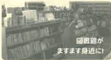
図書館が ますます身近に!