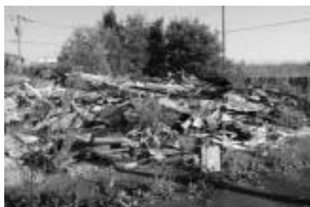
様々な問題が危惧される家屋残骸

態を把握しているが、一 般的な空き家等の実態は 把握していない。今後、 移住希望者などに対する 空き家バンク的な対応を 含め、実態把握に取り組 んでいきたい。 また、廃屋などの所有 者には整理、あるいは処 分という要請をしている が、そのような対応はも う限界だと思っている。 ご指摘のとおり、廃屋 等には景観のみならず環 境衛生、防災、防犯の観 点から必要と判断した場 合には、その所有者に指 導し、指導に従わない場 合には勧告、勧告にも従 わない場合には期限を決 めて命令できる条例の制 定を検討したいと考えて いる。