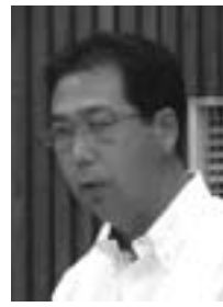
島田 裕司 議員