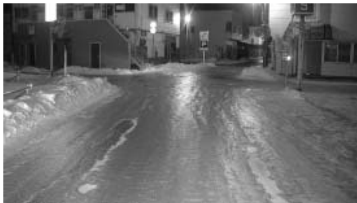
車両にも歩行者にも危険なつるつる路面

また、交通量の多い道路の交差点などはつるつるになり、滑りやすいことから焼き砂を散布するなどしているが、今年度もさらに道路パトロールを強化して適切かつ効果的な散布を行い、道路の安全対策に努めていきたいと考えている。