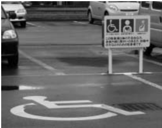
質問後にマーク表示された駐車場(ゆとろ)

町長 現在、ゆとろの専用 駐車場スペースには、車 いすのマークが路面に描 かれていますが、外見では 健常者と見分けがつかな い内部障がい者の方から 「周りの目 が気になっ て駐車しづ らい」との 声がある。 町役場を 始め、ゆと ろ、公共施 設に駐車区 画とともに 内部障がい 者の方、妊 産婦の方が 安心して優 先スペース