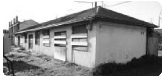
平成19年度までに建てかえる計画だった末広団地

高年齢者の生活特性に配慮したバリアフリー化させたシルバーハウジングプロジェクトを導入していくことなのか伺う。 町長 ケアセンターやシルバーハウジングとは、60歳以上の方向けの住宅のみを対象とするもの