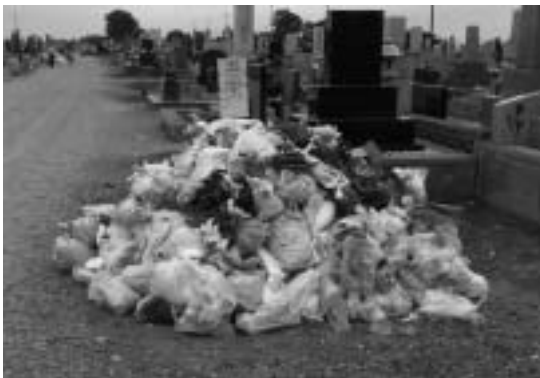
みるに耐えないごみの山

体の3から5%ほどが水浸しになってしまったという状況で、最深20cm強はあったと思う。 このような発生原因は墓地の外回りの側溝の排水機能が不備であったと思われるので、今後、調査を行い、今回のような冠水を最小限度に抑えられるように抜本的対策を講じたいと考えている。 町の第5次総合計画でも墓地の環境保全に努めることを挙げているので、今後具体的な年次計画を立て、必要な環境整備を進めていきたいと考えている。