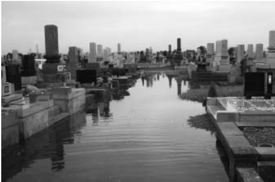
大雨により冠水した東裏墓地

が「私たちの居場所、余りにもひどいのではないのか」と言っていると思う。「申しわけない、すぐに対応します」との思いで、