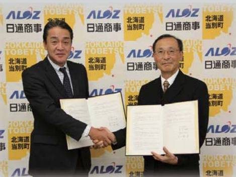
再生可能エネルギー（太陽光発電）の 取り組みも推進