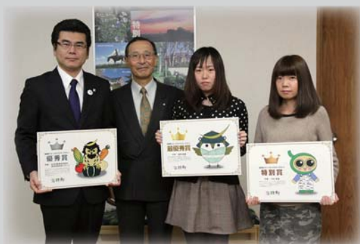
当別町イメージキャラクターには 371点もの応募

今年1年が町民の皆様にとって良い年になることを願い、年頭のご挨拶とさせていただきます。