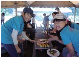
バーベキューで楽しそうに マシュマロを焼く子どもたち

ジュニアリーダーの頼もしい活 躍と低年齢の子との交わりの光景 が微笑ましく、子ども会活動の素 晴らしさを感じとれた一日となり ました。