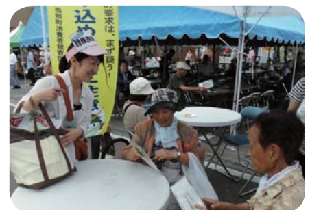
福祉まつりふれあい広場 2016 会場