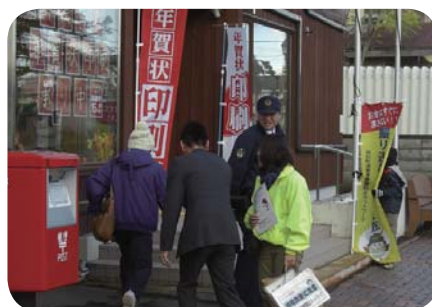
街頭啓発（太美郵便局前）