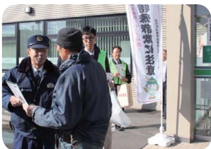
街頭啓発（道銀当別支店前）