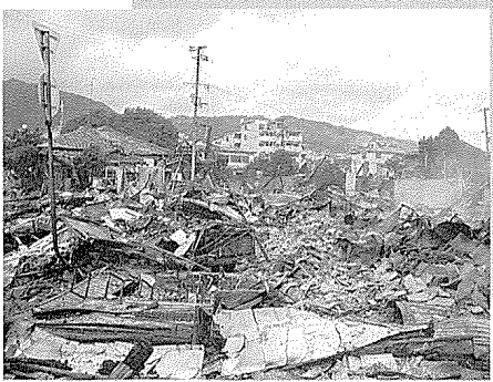
無残に崩れかかった住宅と火災で消失した住宅地（阪神・淡路大震災）

大災害が発生したら、市町村や防災機関は総力を上げて防災活動に取り組みます。 しかし、災害時の地域社会機能の分断などによって、消火・救出・救護などの活動に充分対処できない場合があります。 特に、突然に、そして広範囲に被害をもたらす地震から被害を最小限に食い止めるには、地域の協力体制が不可欠です。町は今年度中を目標に、地域防災計画の見直しを進めています。 家庭の防災を軸に率先して地域の防災活動に参加し、皆さんとともに「災害に負けない、災害に強い」まちづくりを進めましょう。