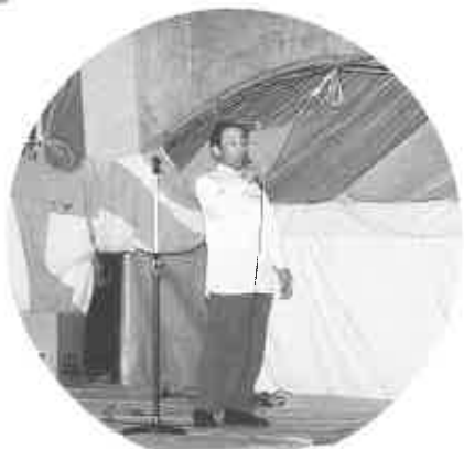
カラオケ大会で自慢ののどを披露