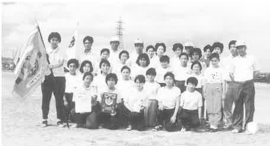
フットベースボールで2年連続9回目の優勝の東裏チーム