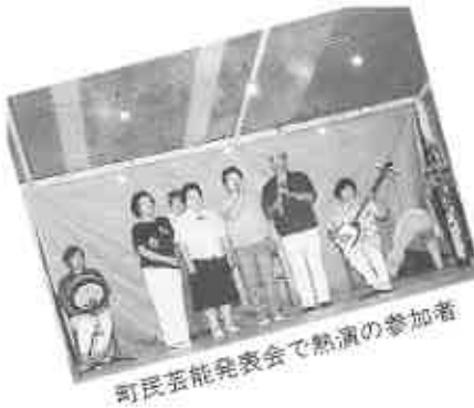
町民芸能発表会で熱演の参加者