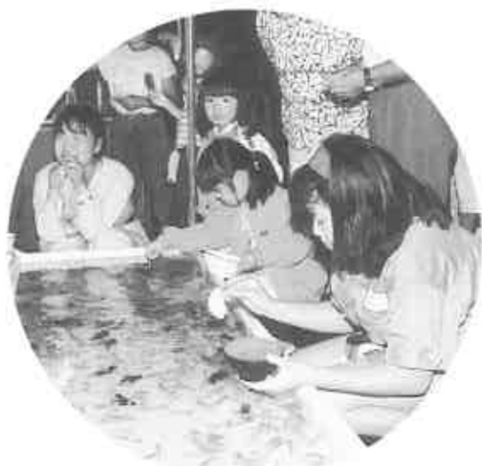
子供たちに人気の金魚すくい