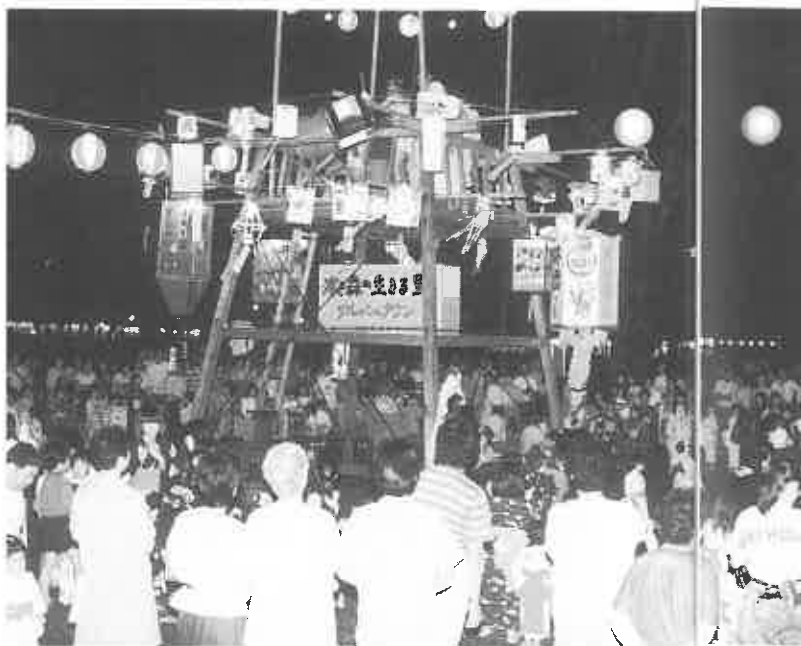
親子盆おどり会場は子供たちでいっぱい

また、日本舞踊西川流の踊りの山車などの披露、奉納相撲大会、夜には大小約40個の手づくりちようちんを飾ったやぐらの下で、親子盆おどりが開かれ、夕涼みの家族連れが踊りの輪を広げ、真夏のまつりを楽しんでいました。