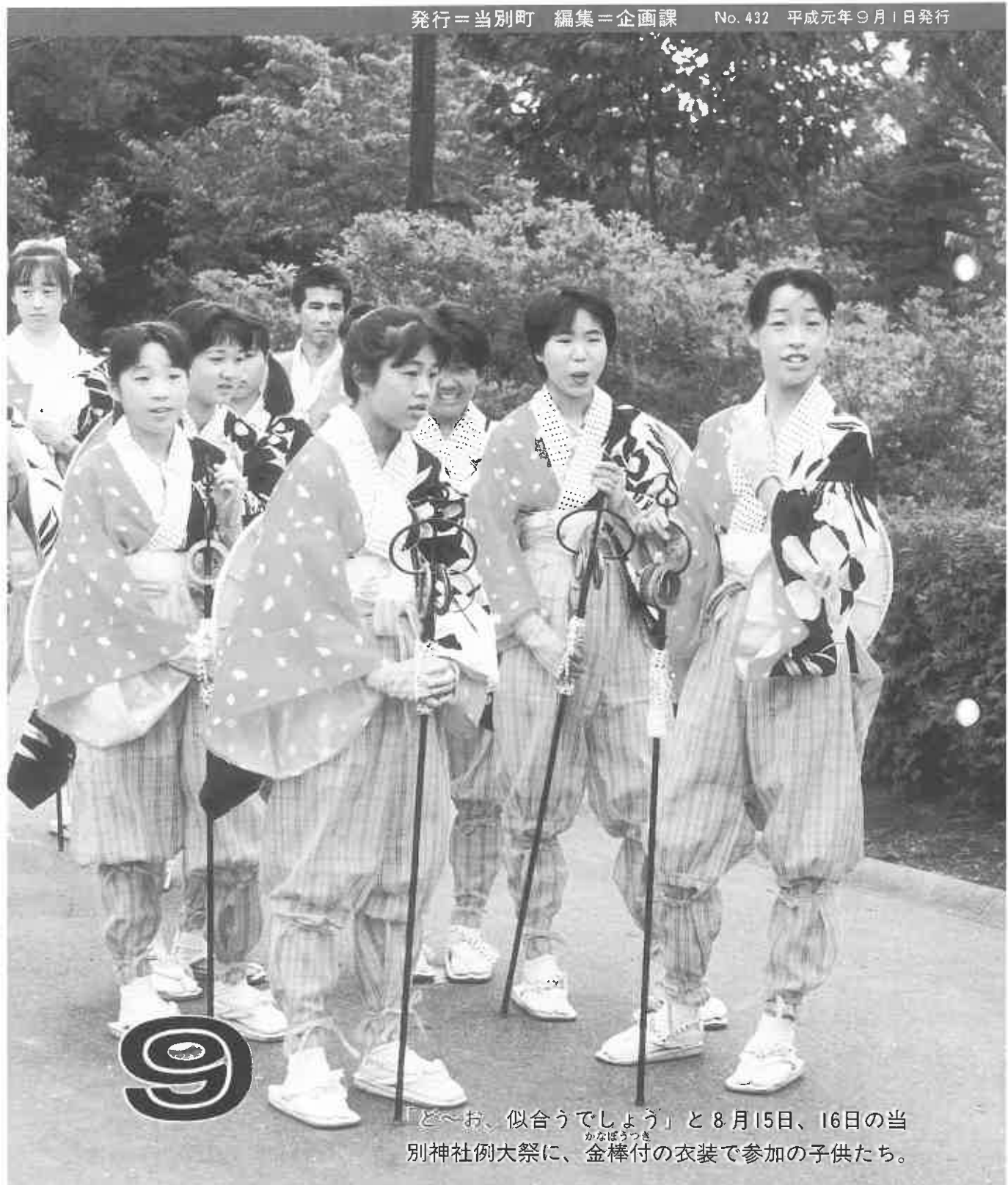
「ど～お、似合うでしょう」と8月15日、16日の当 別神社例大祭に、 かなぼうつき 金棒付の衣装で参加の子供たち。