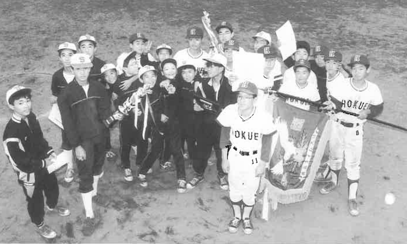
戦い終えて互いに健闘を讃え合う。優勝した北栄町チームと準優勝の栄町・旭町・大町・幸町チーム