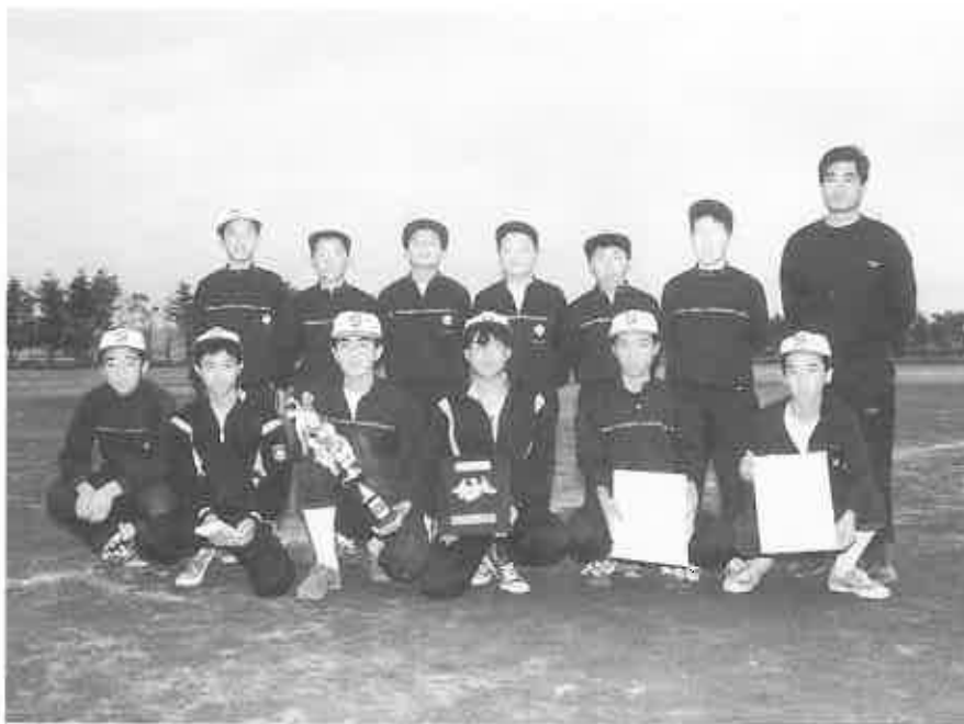
準優勝の栄町・旭町・大町・幸町チーム