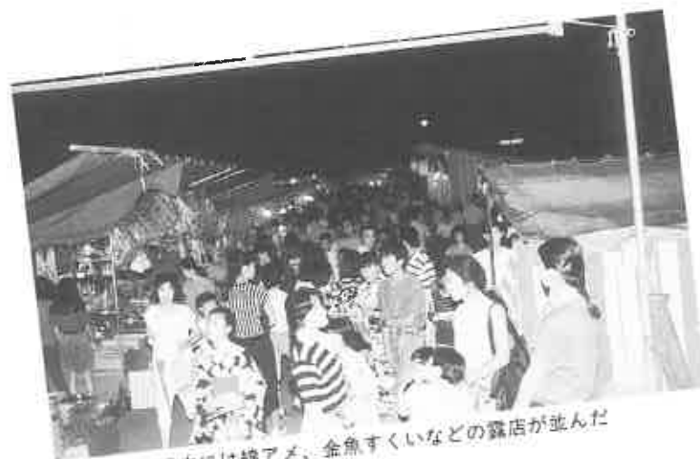
境内には踊アメ、金魚すくいなどの露店が並んだ