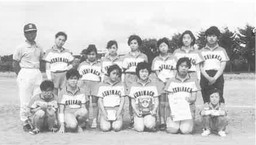
準優勝の西町チーム