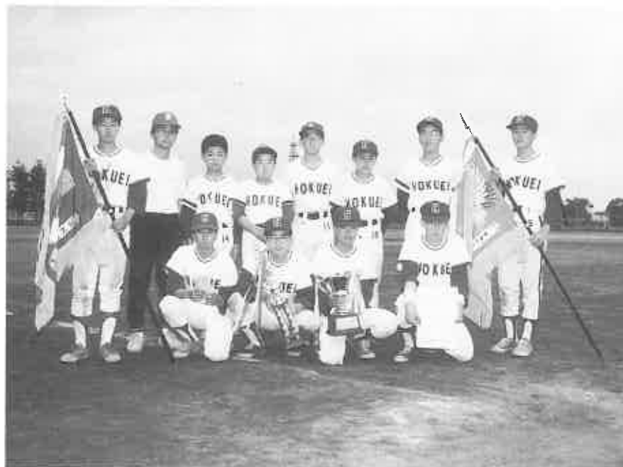
野球で優勝した北栄町チーム