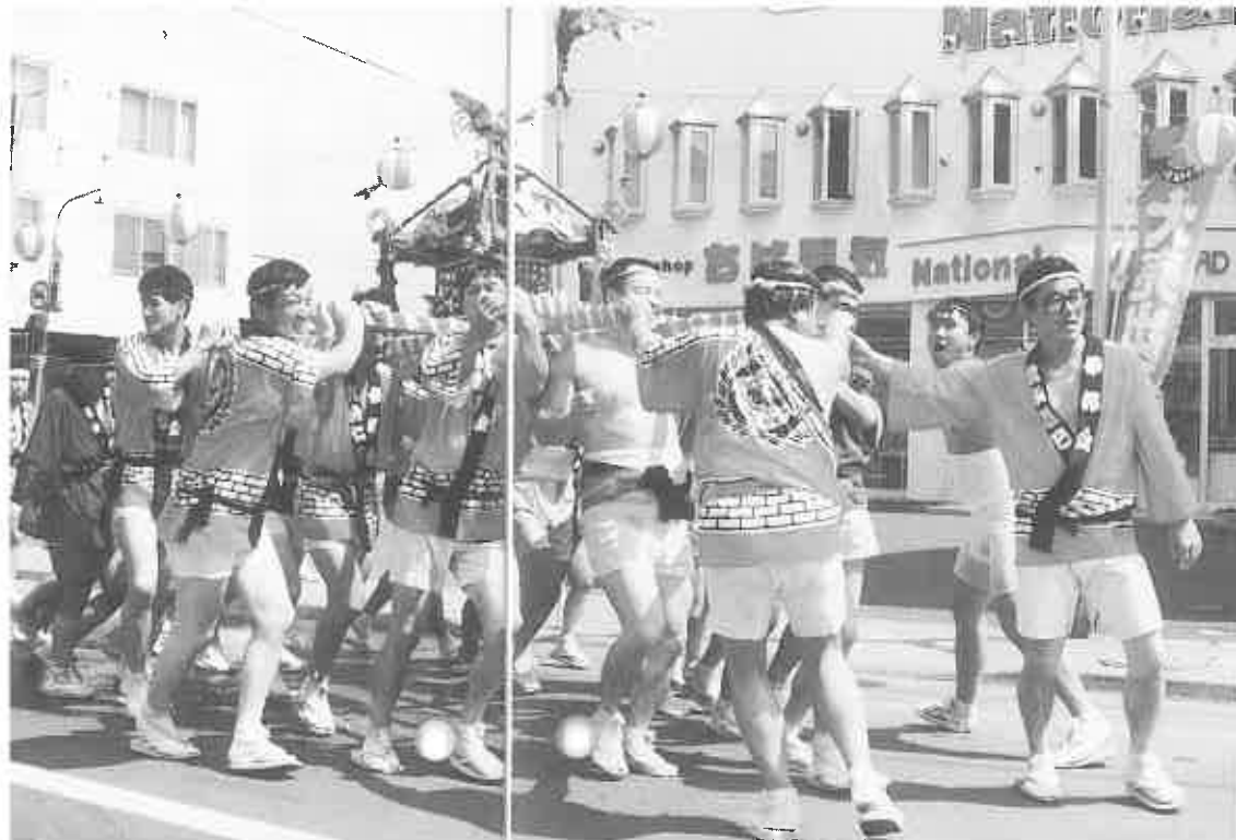
掛け声勇ましい伊邦会のみこし

当別神社の例大祭が8月14日から16日までの日程で行われ、当別神社境内や阿蘇公園には、露店が約70店余り並び、期間中は大勢の家族連れでにぎわいました。 好天に恵まれた宵宮祭の14日は、境内の特設ステージで第9回カラオケ大会が行われ 25人が出場し、日ごろの自慢を披露していました。本祭りの15日は、午前10時から恒例のみこし渡御が神社を出発し、約2000人が参加し町内を練り歩きました。 みこしは、伊邦会のかつぐみこしと子供樽みこしなど3つで、暑さにも負けず「ワッ