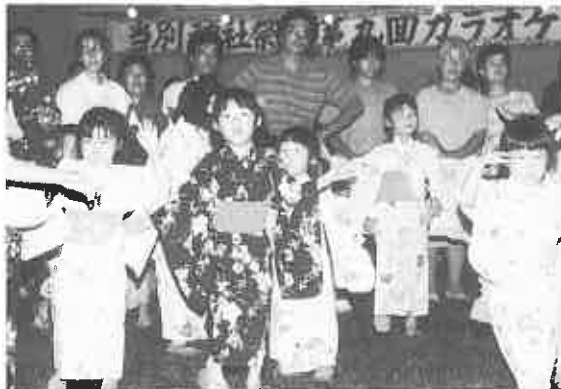
子供たちもおどりの輪を広げまつりを楽しんだ