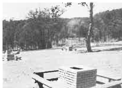
▲野外バーベキュー施設

健康の森」「学習の森」の3地区に分け、約38億円かけてキャンプ場や国際交流の森、湿性植物園などの施設を建設する計画です。