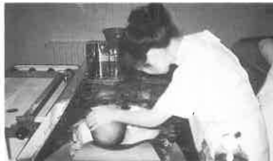
りのご家庭は問い合わせのうえ、是非ご利用ください。