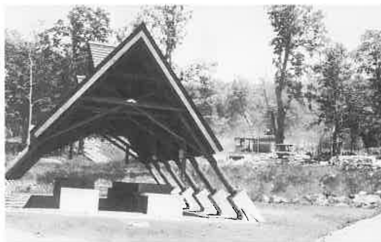
▲キャンプ場そばの炊事棟

一昨年から始まった工事は、神居尻地区を中心にキャンプ場、道民の森、駐車場、交流広場、登山道、炊事棟、