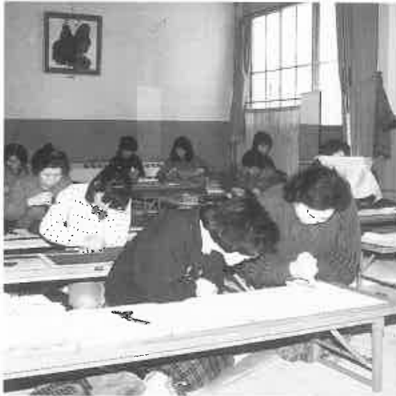
年々受講者が増えている和裁教室