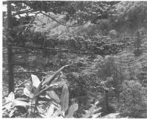
山火事から山の緑を守りましょう

当別町の森林面積は、26、608畝で町全体の面積の63・3%にもなります。5月1日から山火事予防期間となりますが、昨年の全道の林野火災は、29件で57畝、1、353万円の被害となっています。