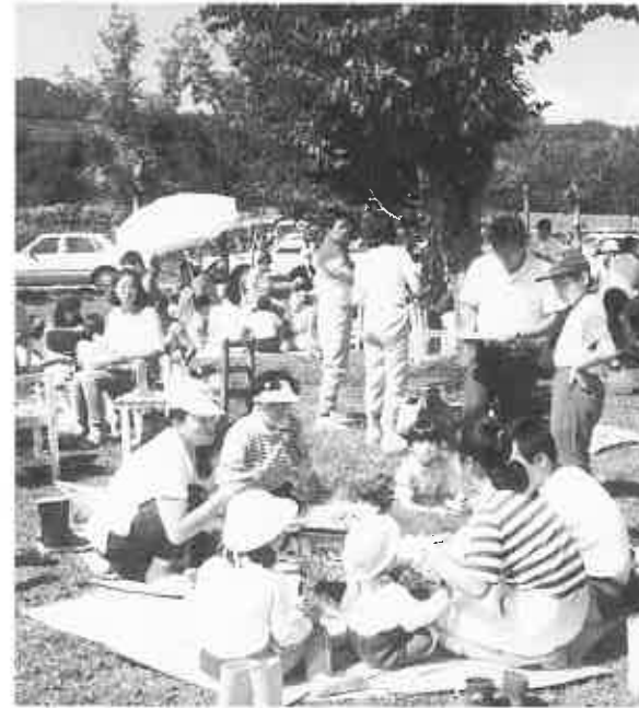
▲ジンギス汗コーナーで弁当をひろげる家族連れ