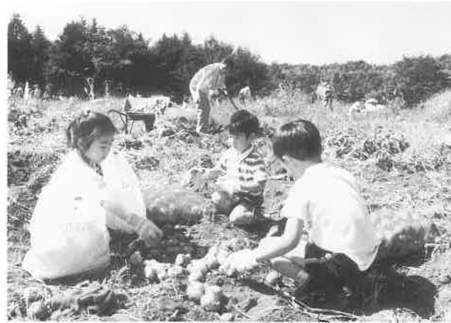
▲土の中からジャガイモがころころでてる=昨年9月収穫まつり