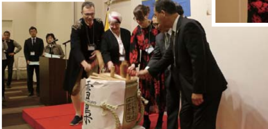
一層の友好を願っての鏡開き

レクサンド訪問団音楽学校生による演奏のほか、ホストファミリーへの感謝の言葉、4日間の記念事業を映像で振り返りました。