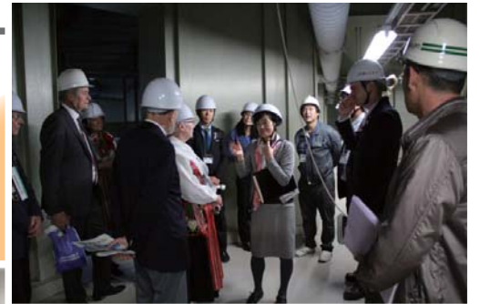
産業コース JA北いしかりのライスターミナルを視察