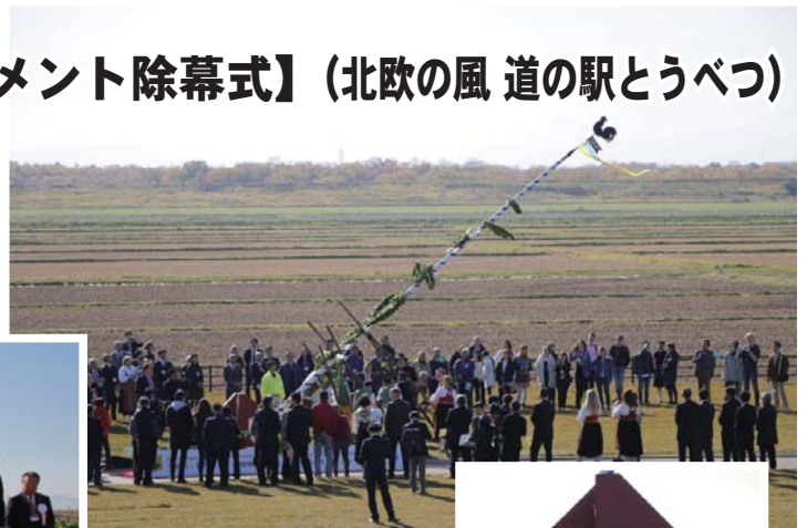
道の駅に設置された記念モニュメント（マイストングの土台）