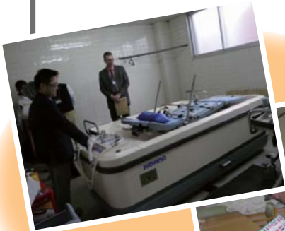
福祉コース 長寿園を視察