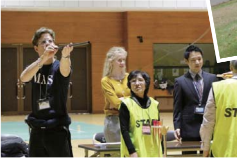
スポーツ吹矢体験