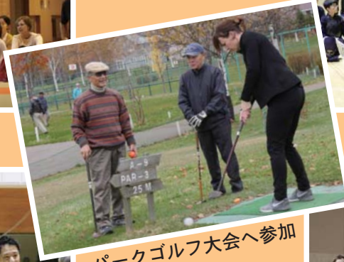
パークゴルフ大会へ参加