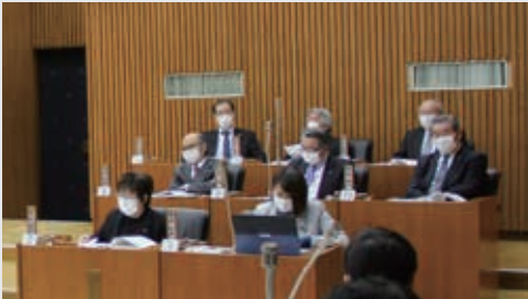
議場ではマスクを着用