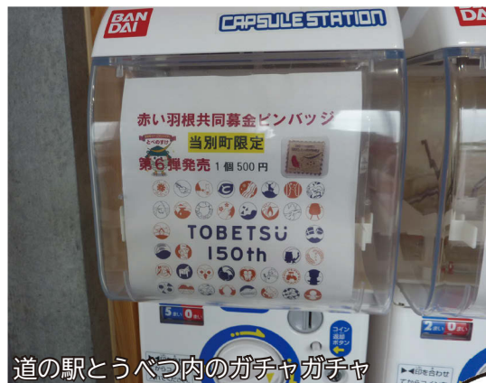
道の駅とうべつ内のガチャガチャ