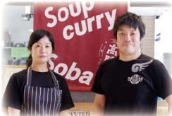
高陣 CUP STORE 西川夫妻 おすすめ 10/15 ~ 31 限定!

今回は、野菜ソムリエプロの奥様が考案する野菜たっぷりのスープカレーが大人気の高陣 CUP STORE からハロウィン限定メニューを紹介！