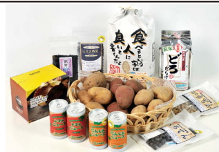
当時のふるさと納税返礼品

その寄付金を活用し、まちのブランドづくりとして、札幌市での軽トラマーケットの実施や首都圏での物販、PRツール・動画も作成しました。