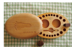
乳歯入れ オーダー家具