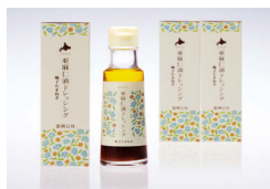
亜麻仁油ドレッシング