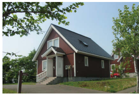
来町体験型の返礼品を追加