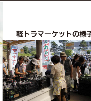
軽トラマーケットの様子