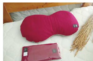
もみがらまくら・ まくらパッドセット

米のマチ当別町ならではの副産物「もみがら」を活用した地域資源循環の品です。もみがらまくらは抜群の通気性、頭をのせたときの天然のクッション性、首肩にフィットするオリジナルの形とデザインが特徴です。まくらと同色の布と柔らかなトリプルガーゼを組み合わせた専用パッドのセットになります。