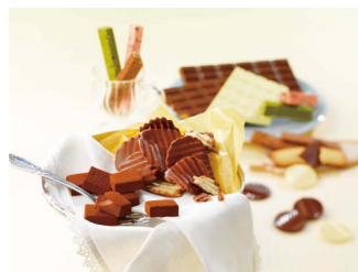
ROYCE' 人気スイーツ 詰め合わせ (A)

北海道のお土産として大人気の生チョコレート「オーレ」、ポテトチップチョコレート「オリジナル」を含む計5点以上の商品が入った詰め合わせです。この他、人気のチョコレート菓子18種/計134個を高級感のあるボックスに詰め合わせたふるさと納税オリジナルギフトなど、様々な詰め合わせがあります。