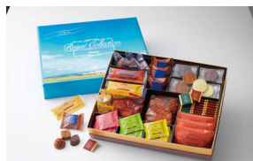
ROYCE' ふるさと納税 オリジナル詰め合わせ ロイズコレクション 【ふと美の風】