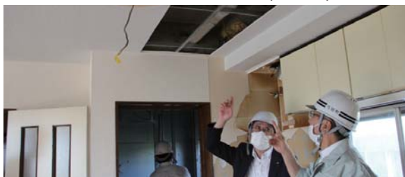
子育て向け公営住宅 (下川町)