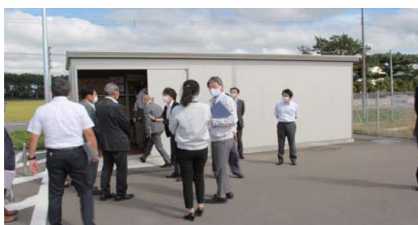
道の駅の防災倉庫 (当別太)

道の駅防災倉庫、新駅予定地、図書館、図書館西当別分館を視察し、担当課から説明を受けました。役場に戻った後、GIGAスクール構想についても、教育委員会から説明を受けました。