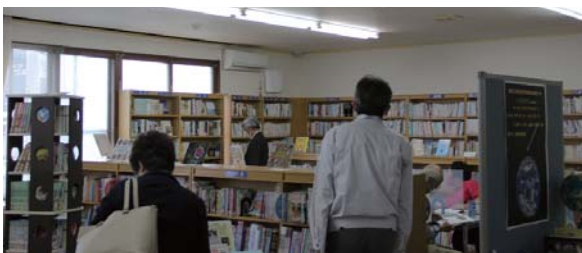
当別町図書館 (錦町)