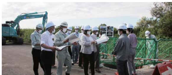
下水道管更新工事現場 (太美北)