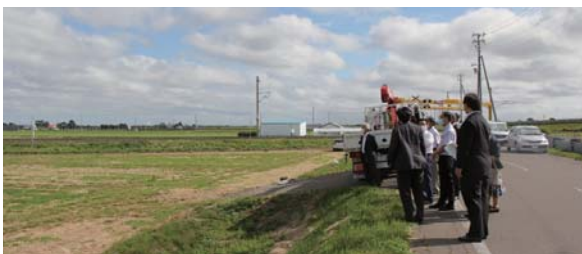
JR札沼線 新駅予定地 (当別太)