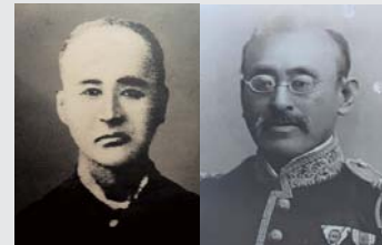
伊達邦直公(左)と伊達邦成公(右)

当別町は兄の伊達邦直公が、伊達市は弟の伊達邦成公が、それぞれ開拓の基礎を築いており、当別町と伊達市には、歴史的な深い縁があります。昨年、伊達市が開拓150年、今年、当別町が開拓150年の節目を迎えたことから、このたび「歴史兄弟都市」の盟約を結びました。これにより、今後は教育・文化・産業など、議会も含めてさまざまな分野で、交流が図られていくこととなります。