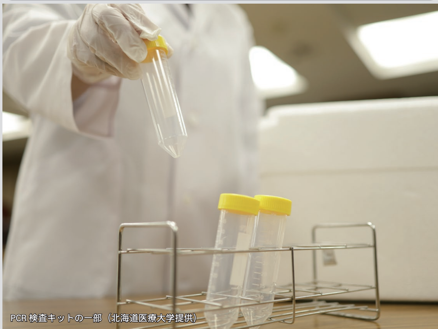
PCR検査キットの一部