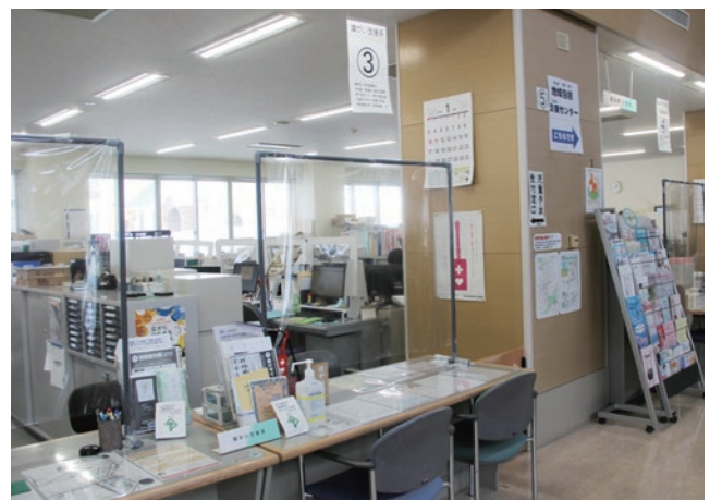
タブレット配置予定の障がい支援係(ゆとろ)

タブレット 2 台を Wi-Fi 環境が整っている役場とゆとりに配置する計画。タブレットは持ち運び可能であるので、例えばポケット Wi-Fi ※2 による利用などを現在研究している。