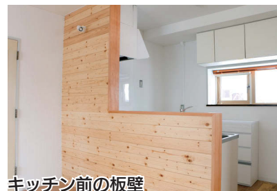
キッチン前の板壁