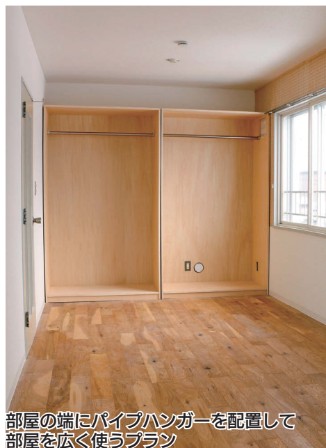
部屋の端にパイプハンガーを配置して 部屋を広く使うプラン