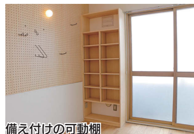
備え付けの可動棚