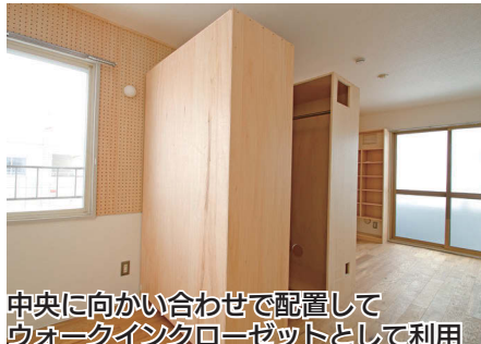
中央に向かい合わせて配置して ウォークインクローゼットとして利用