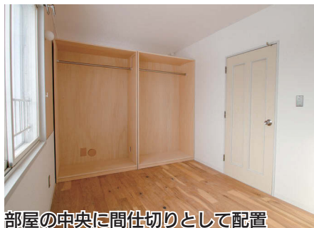
部屋の中央に間仕切りとして配置