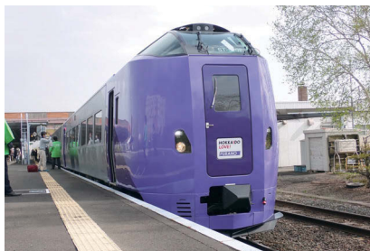
「ラベンダー」編成車両

ロイズタウン駅の開業を記念して、昨年5月に登場したばかりの多目的特急車両「ラベンダー」編成の特別列車が運行します。学園都市線では初登場となる「ラベンダー」編成を、この機会にご覧ください。 ※体験乗車の募集は終了しています。