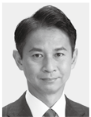
谷あい 正明 現3 元農林水産副大臣、党参議院幹事長、京都大学大学院修士課程修了、49歳。