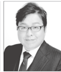
さくらい まこと 党首 桜井 誠