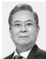
よこやま 信一 現2 前復興副大臣、北海道大学大学院博士課程単位取得、水産学博士、62歳。