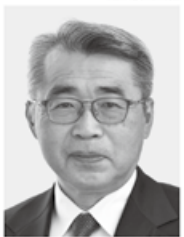
宮崎 まさる 現1 前環境大臣政務官、党環境部会長、埼玉大学工学部卒、64歳。