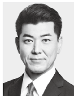
立憲民主党 代表 泉 健太