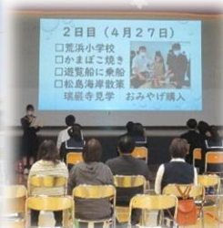
修学旅行まとめ発表会の様子