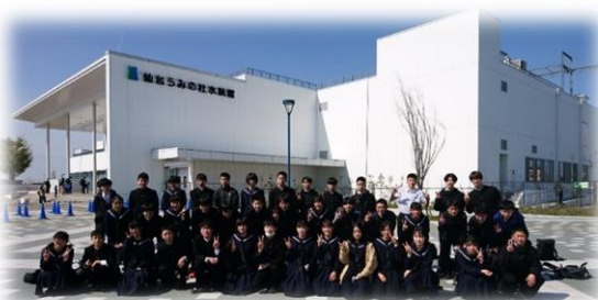
仙台うみの杜水族館での学年写真

行きの飛行機の到着遅れのため、離陸時刻が10分遅れるということはありませんでしたが、予定通りの行程で旅行を進めることができました。心配された天気も1日目の夕方に小雨が降る程度で、比較的良い天気の中、仲間との思い出や集団生活の中で自分の役割を果たす大切さなど多くのことを学ぶことができた3日間となりました。出発までは、いろいろなことを心配しましたが、おかげさまで、大きな事故や体調不良、災害などにあうことなく無事に終わることができたことに感謝申し上げます。