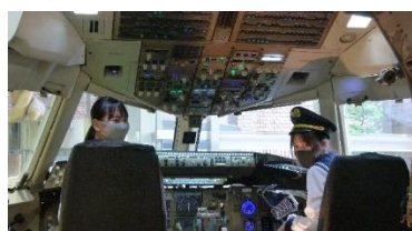
コックピットでパイロット気分

をしています。楽しい中でも自分の自由にはならないことも経験し、自分を見つめ直すことができる機会になったことでしょう。そのような活動が少しずつ大人になっていく過程だと思います。活動の中には自主研修で札幌市内をグループで回