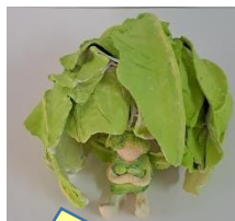
美術作品 「レタスと妖精」

嫌なことを避けてばかりでは前へ進めません。何事にも 立ち向かう力を身につけてほしい ものです。今年度はBe Strong～たくましく生きよ～を掲げていますが、子どもたちが少しでもそれに近づけるような学校を目指しています。