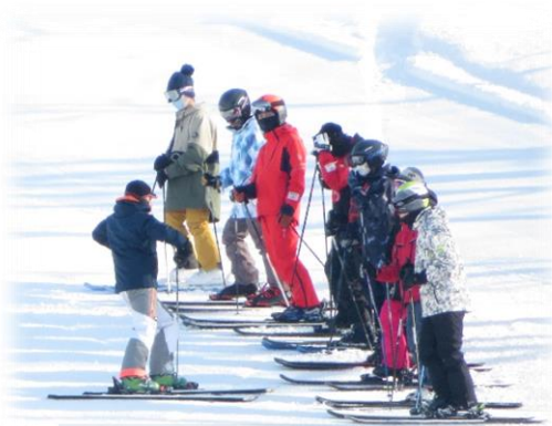
スキー学習のひとコマ