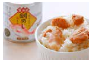
混ぜるだけ鯛めしのもと（1缶／2合分）