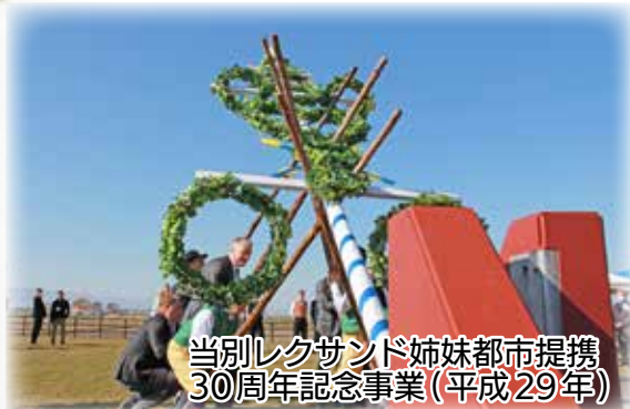
当別レクサンド姉妹都市提携30周年記念事業(平成29年)

レクサンド市との姉妹都市提携30周年を記念し、道の駅にマイストングの土台を設置。レクサンド市と当別町双方の有志が立ち上げを行いました。