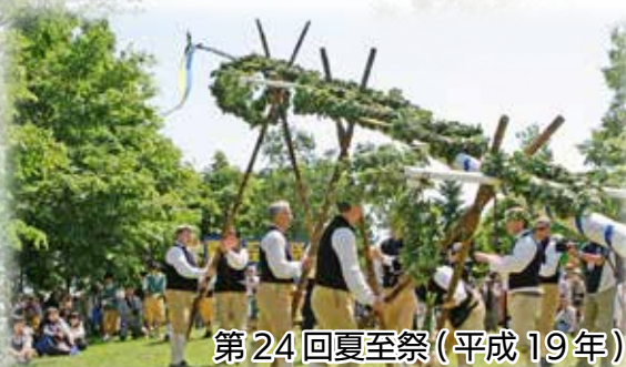
第24回夏至祭(平成19年)

第24回は当別町・レクサンド市 姉妹都市提携20周年記念として、レクサンド市から訪問団が来町。より一層本場を思わせる雰囲気です。