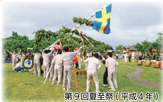
第9回夏至祭(平成4年)

第9回の頃にはスウェーデンヒルズでの開催に。作業服を着た役場職員がマイストングの立ち上げを行っている様子はさながら工事現場のようです。