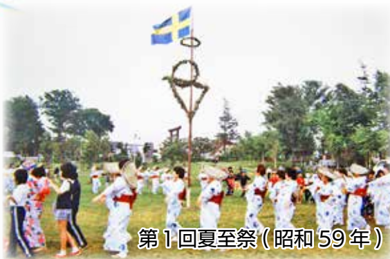
第1回夏至祭(昭和59年)

第1回は阿蘇公園での開催。マイストングの周りを浴衣姿で当別音頭を踊っている光景はこの頃ならではの。