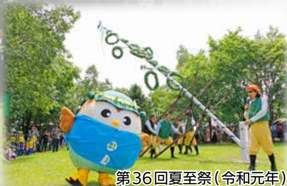
第36回夏至祭(令和元年)

直近のマイストングの立ち上げは4年前の第36回夏至祭。とべのすけがスウェーデン国旗カラーの衣装をまといました。