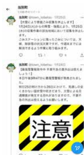
↑町公式 Twitter 画面