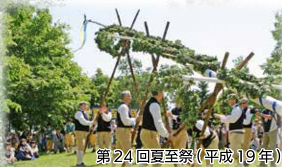
第24回夏至祭(平成24年)

第24回は当別町・レクサンド市 姉妹都市提携20周年記念として、レクサンド市から訪問団が来町。より一層本場を思わせる雰囲気です。