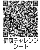
健康チャレンジシート

※「健康チャレンジシート」と「申請書」はゆとろ、役場、西当別コミセンにも設置しています。