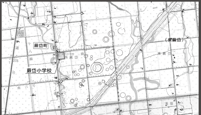
この図は昭和23年6月8日に米軍が撮影した航空写真をもとに、Stereo Metric Pro ver.8.0を用いて図化したもの。点線で表示した円は、遺跡跡の可能性があると判読できる(作成協力/宮塚文化財研究所、シン技術コンサル)。

ただ、それらしきものは見えても、発掘調査をして建物跡だと確認できなければ、豎穴群があったと確実なことはいえない。擦文文化期(7~12世紀)の豎穴建物跡が埋没して残っていることがわかれば、まぼろしの豎穴群が再び姿を見せることになる。