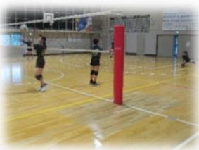
6人制のバレーボールの支柱が立てられるようになりました

暑い日が続きましたが、工事業者の方々のおかげで予定していた工事を夏休み中にほぼ終わることができました。ありがとうございました。体育館の外壁工事は、もう少しかかりますが、明るい感じの新しい外壁になっています。