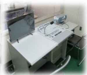
新しくなった放送室の放送設備