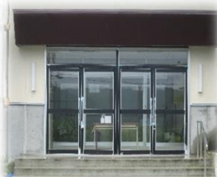
新しくなった体育館玄関