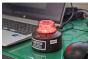
相談先の課で ランプが点灯