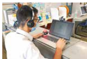
職員が応答し 相談業務を行う