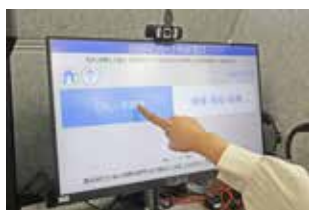
利用者が相談先を タッチパネルで選択