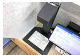
利用者は書画カメラで 書類を見せながら相談可能