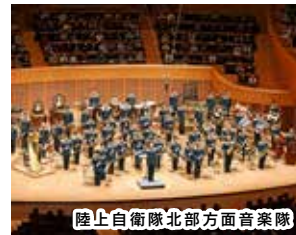
陸上自衛隊北部方面音楽隊

日程 10月28日(土) 14時開場、15時開演、総合体育館 料金 無料 ※日時、内容等は、変更となる場合がございますのでご了承ください。