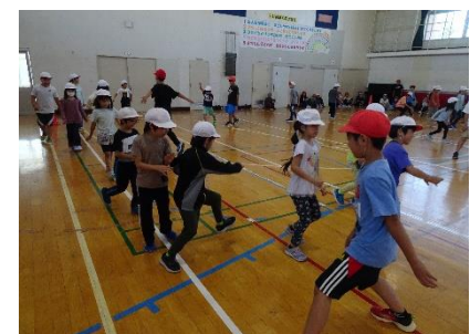
1・6年「じゃんけん列車」 「玉入れ」